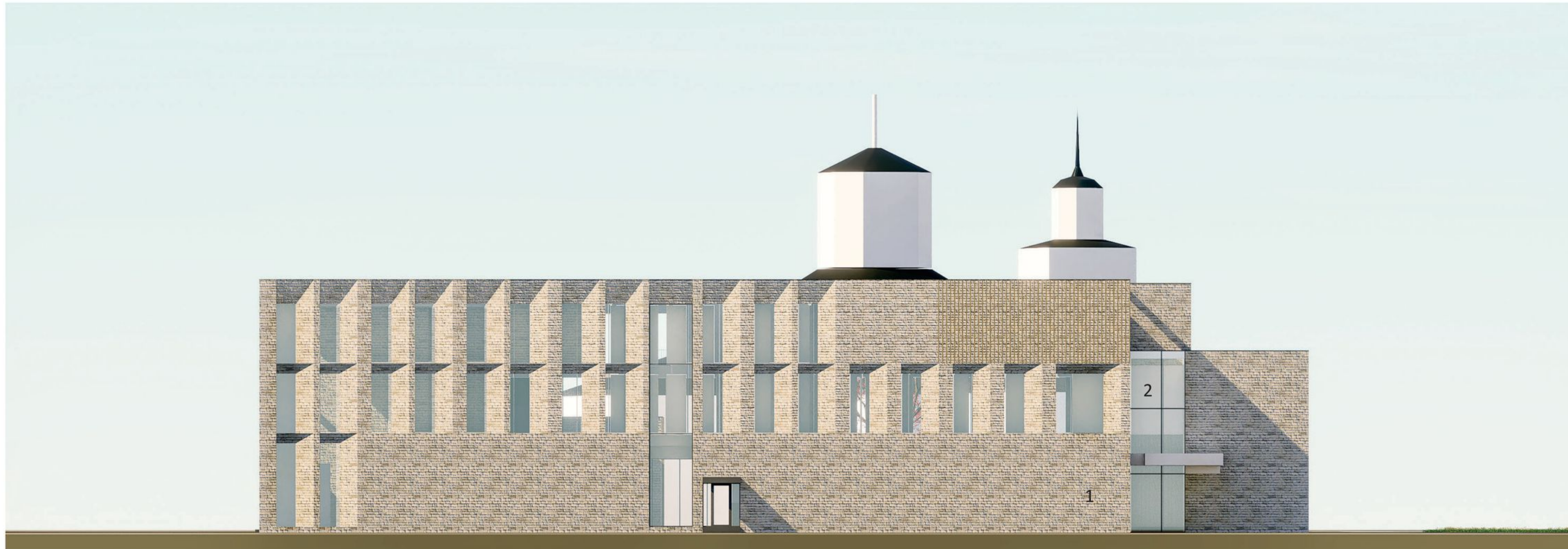
Julkisivu länteen 1:250