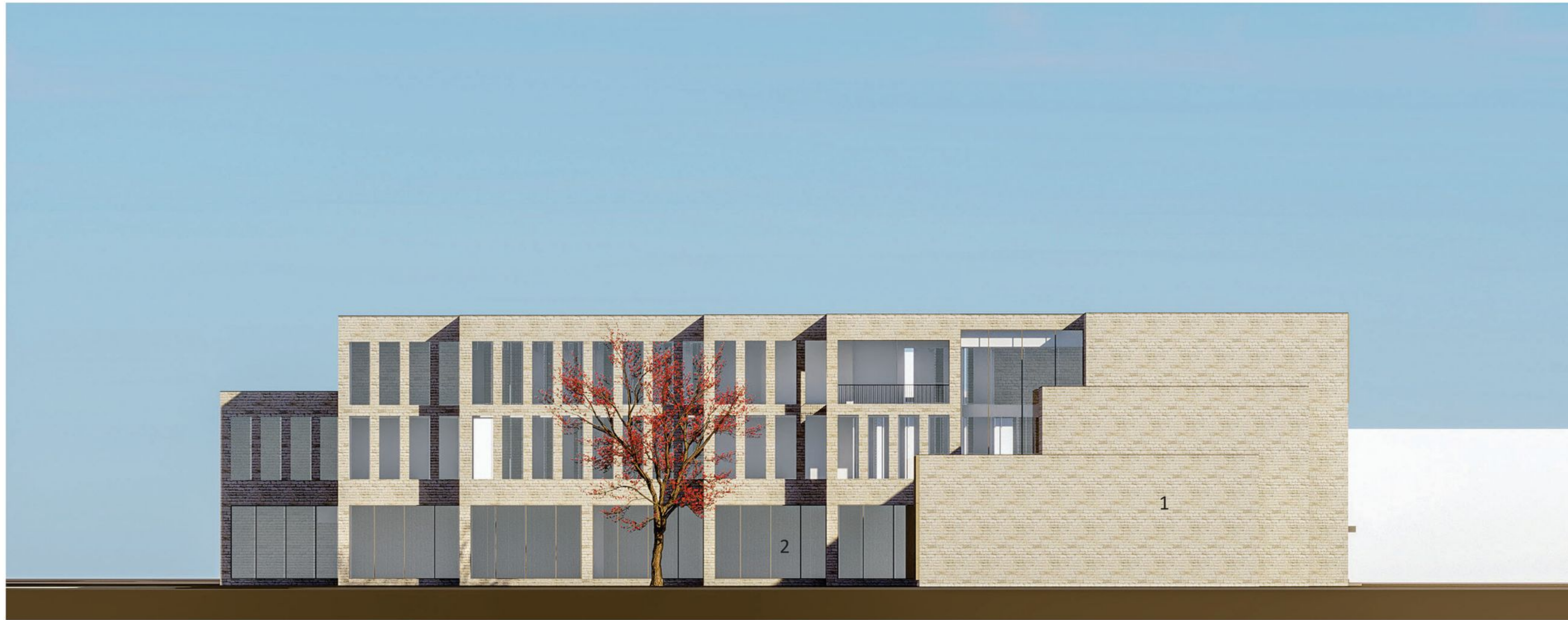
Julkisivu itään 1:250