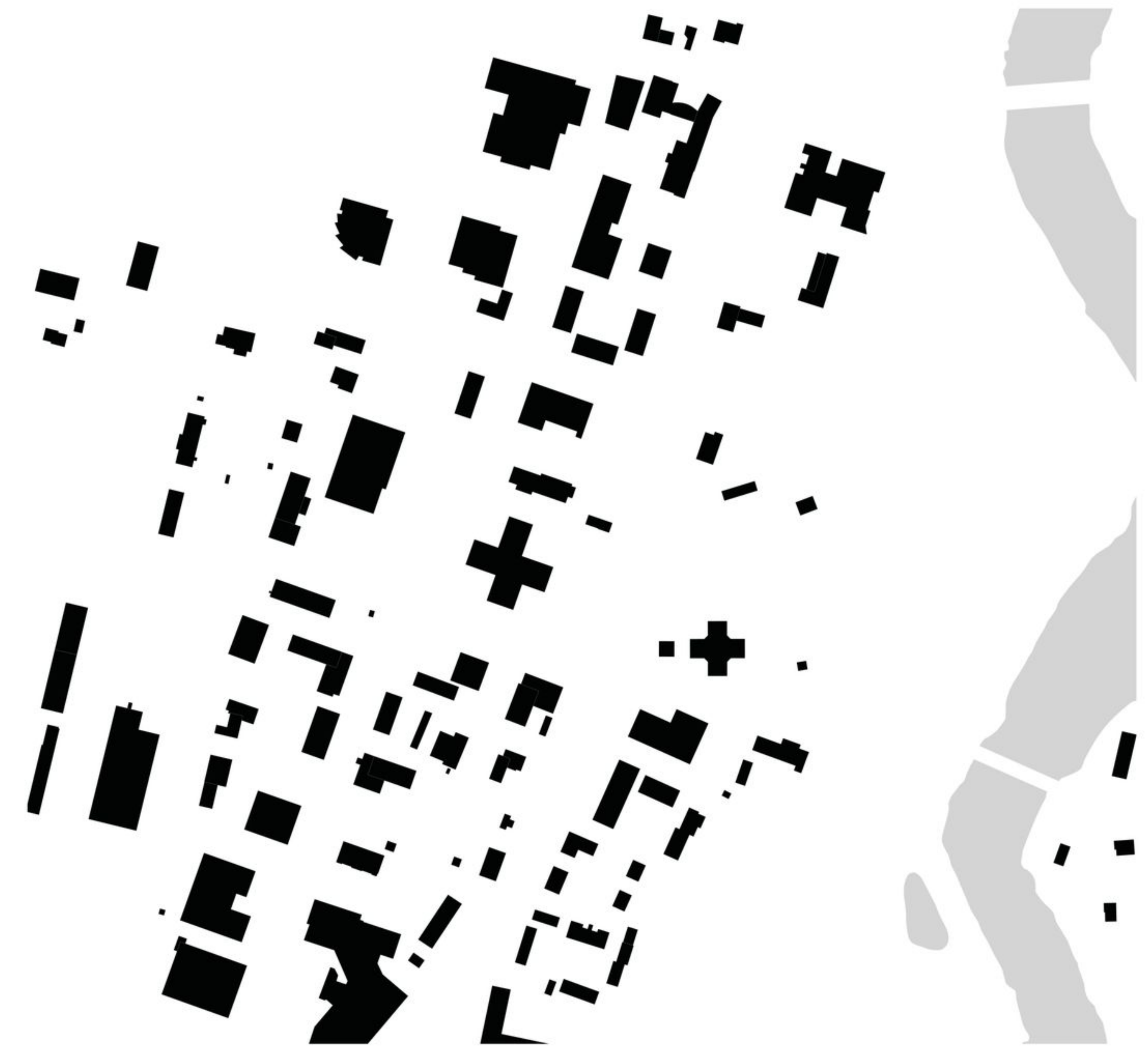
Liittyminen ympäristöön 1:5000