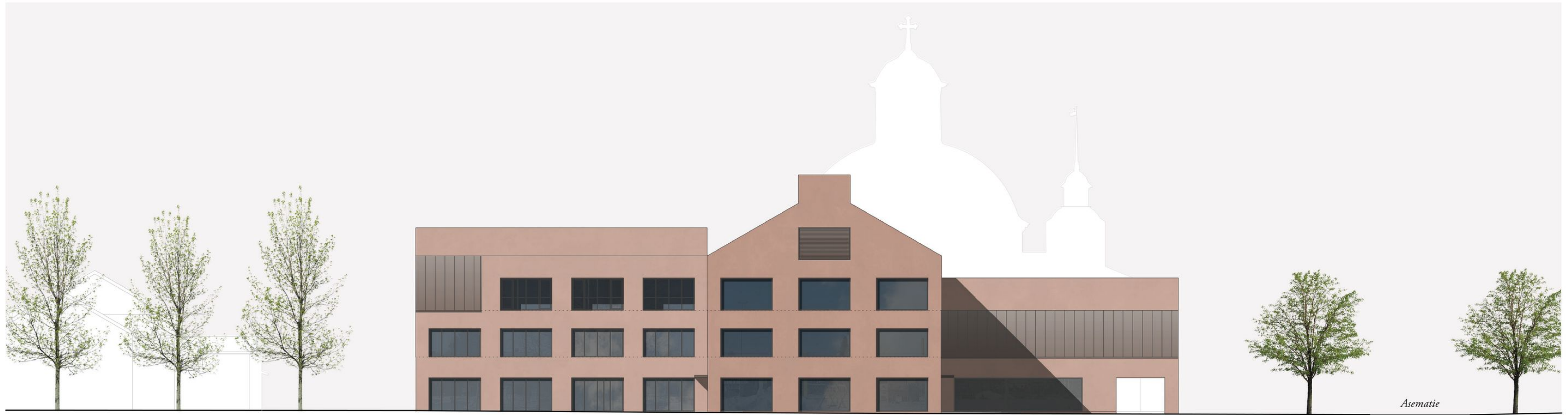
Julkisivu itään 1:300