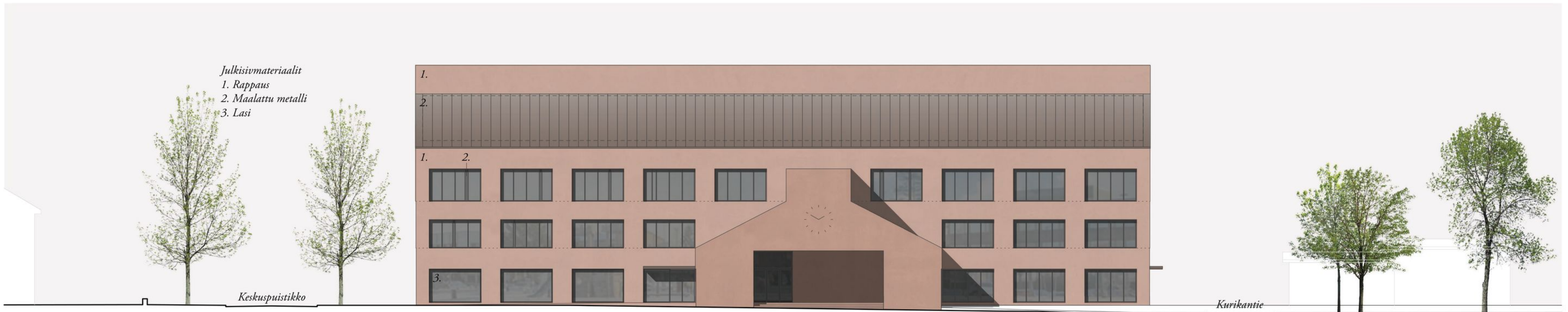
Julkisivu etelään 1:300