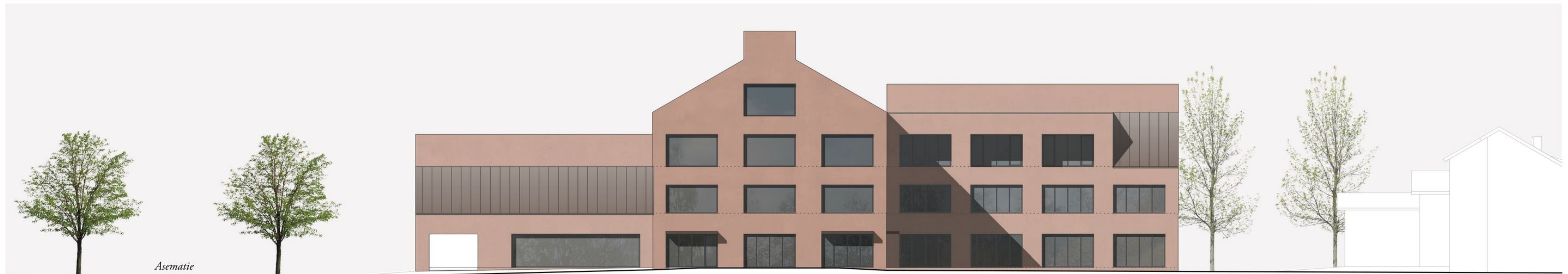
Julkisivu länteen 1:300