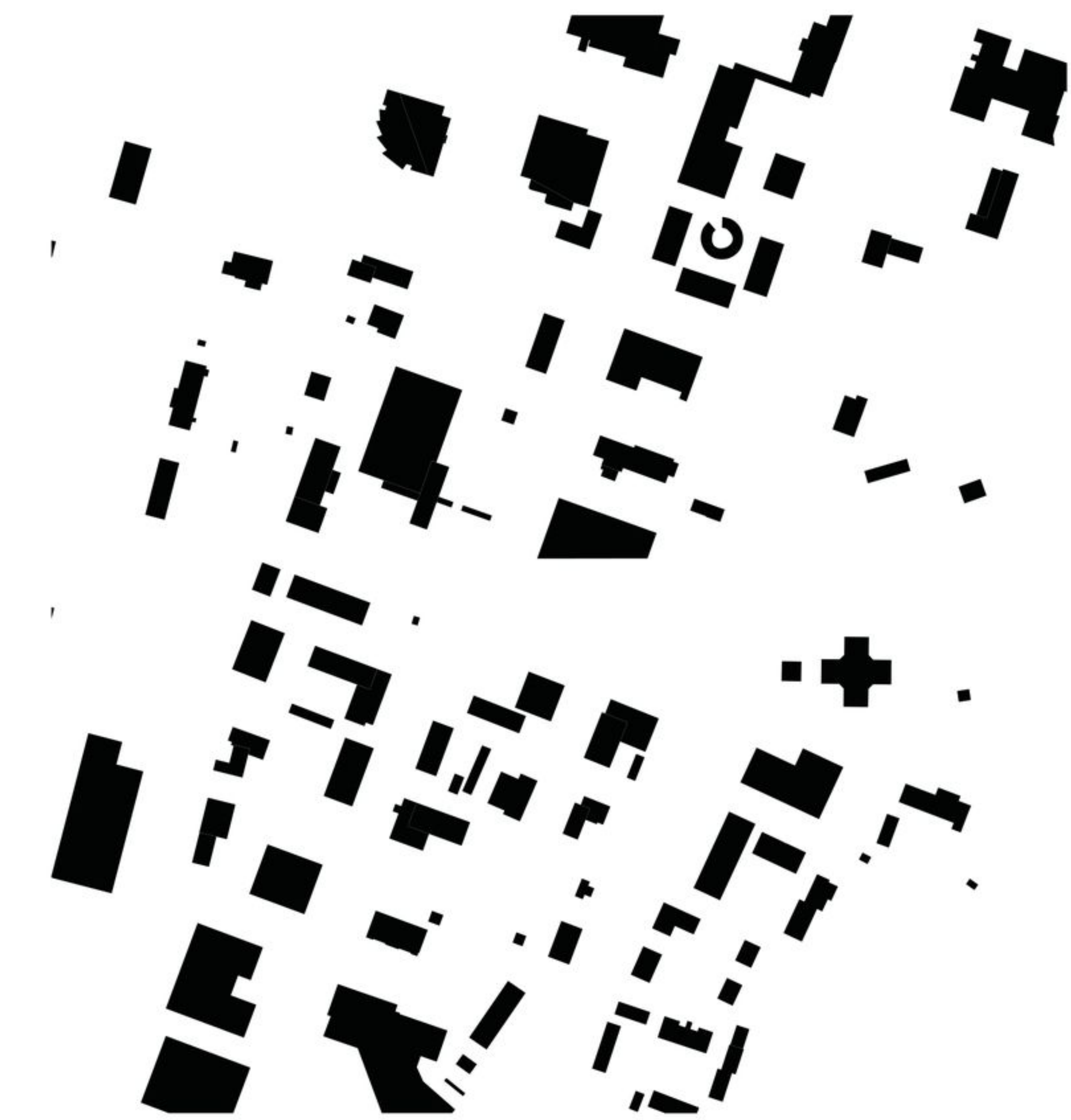
RAKENNUKSEN LIITYMINEN YMPÄRISTÖÖN 1:5000