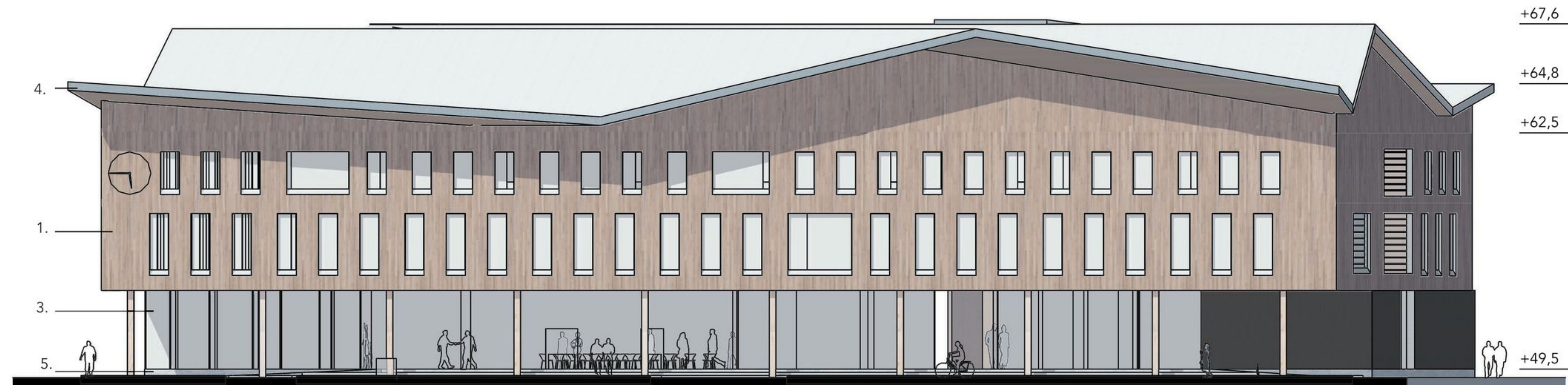
JULKISIVU ETELÄÄN 1:250