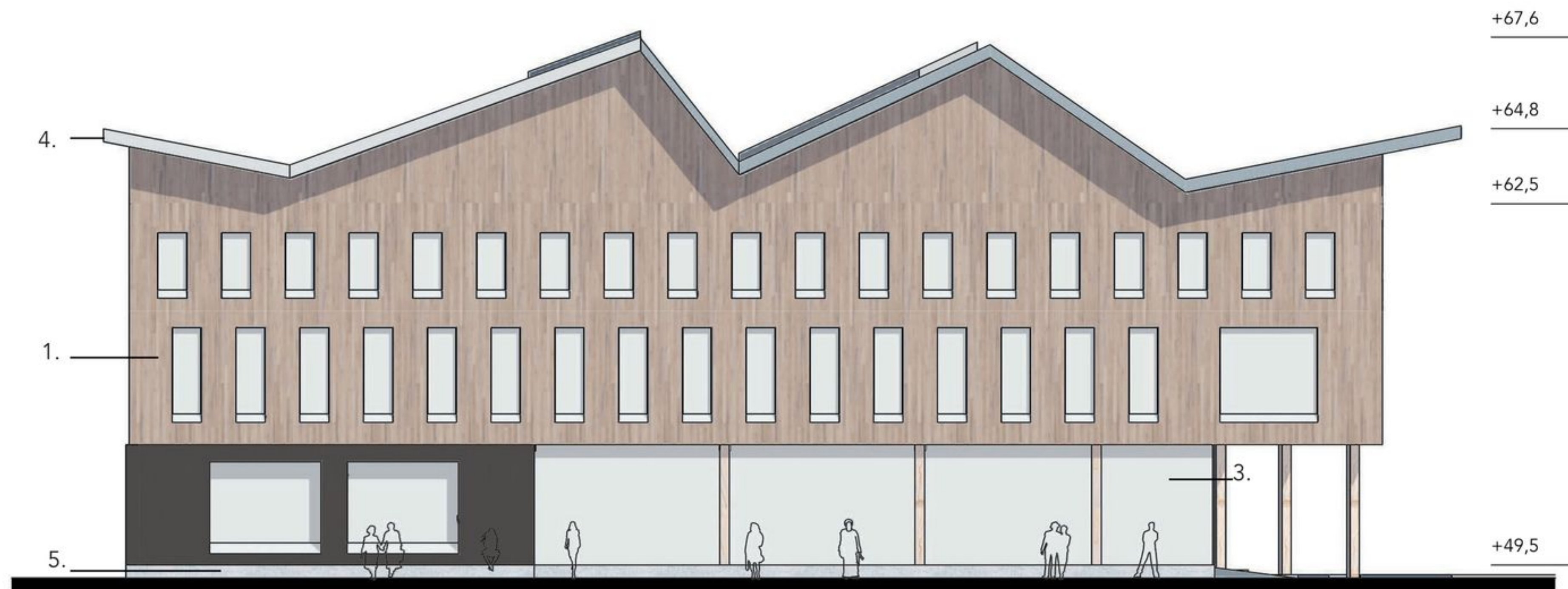
JULKISIVU LÄNTEEN 1:250