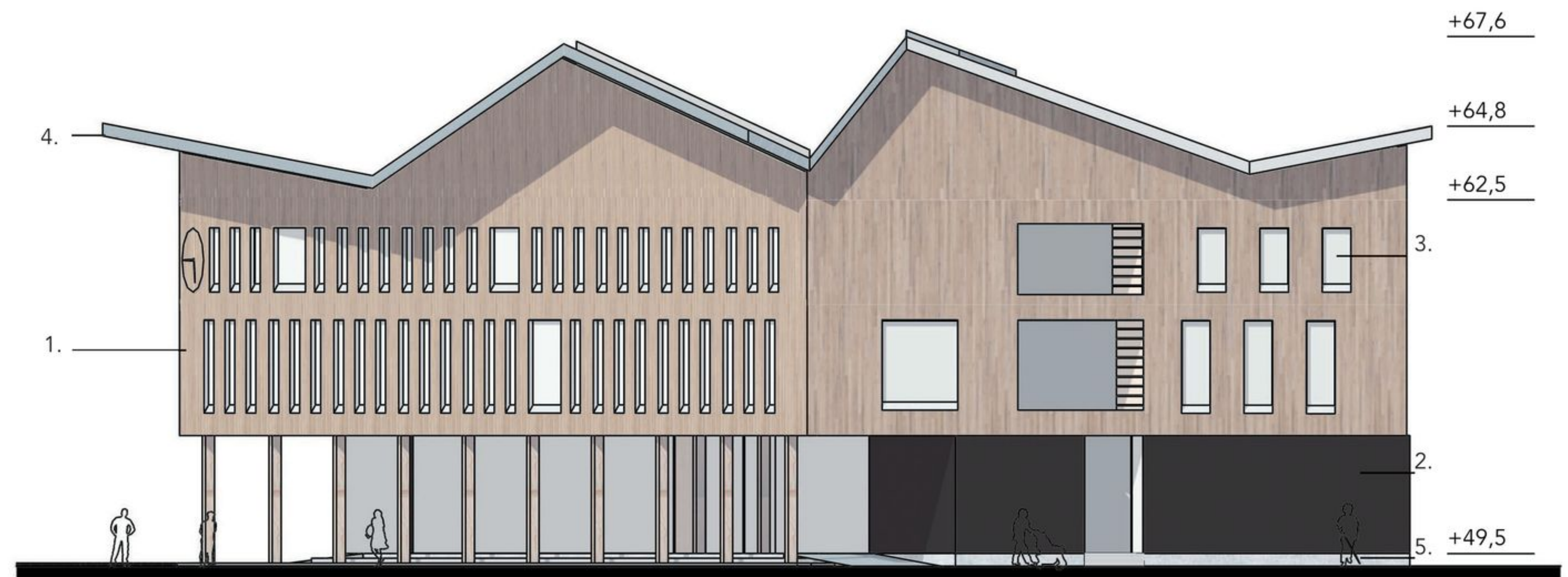
JULKISIVU ITÄÄN 1:250