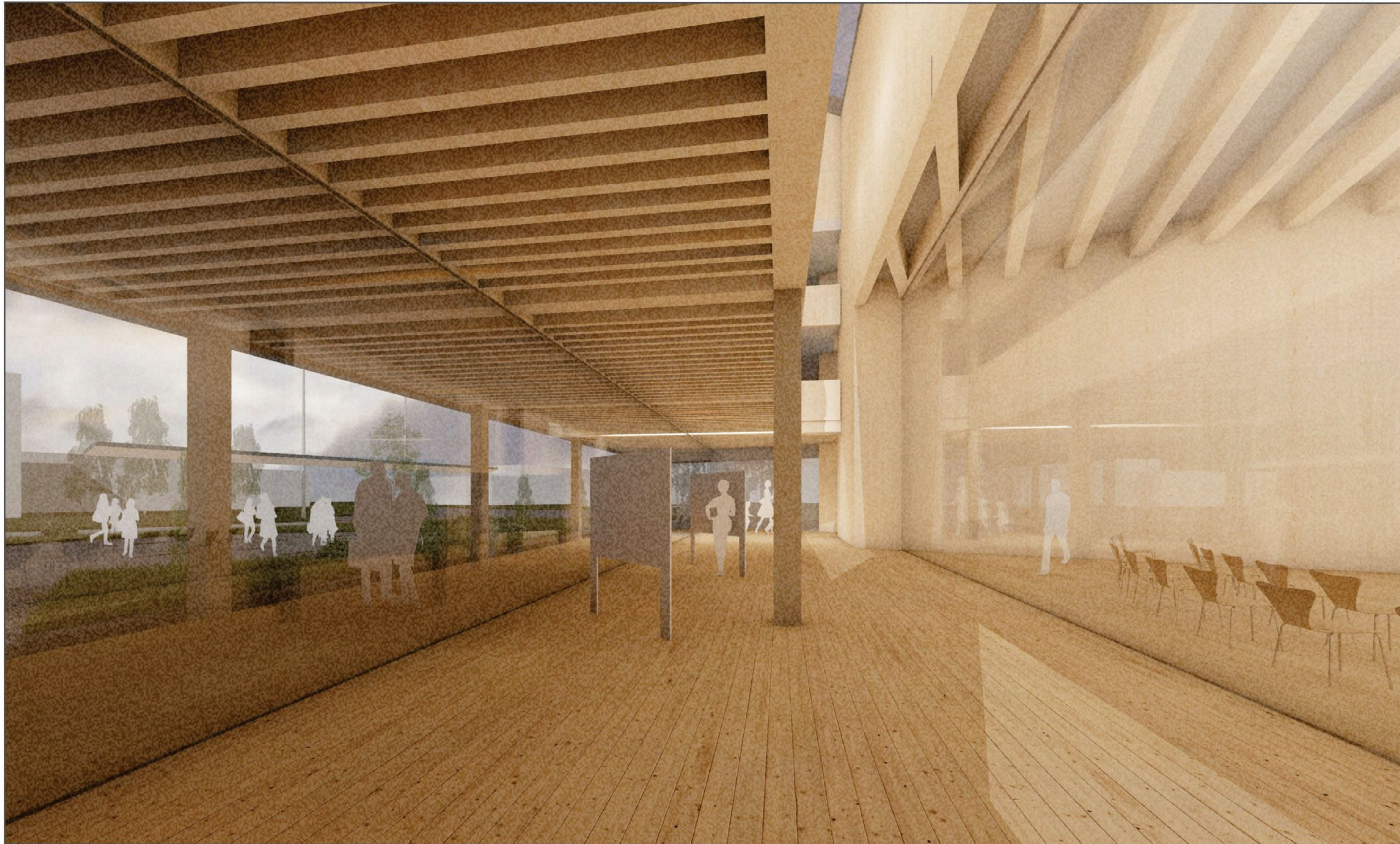
NÄKYMÄ AULASTA NÄYTELYTIILAAN JA VALTUUSTOSALIIN