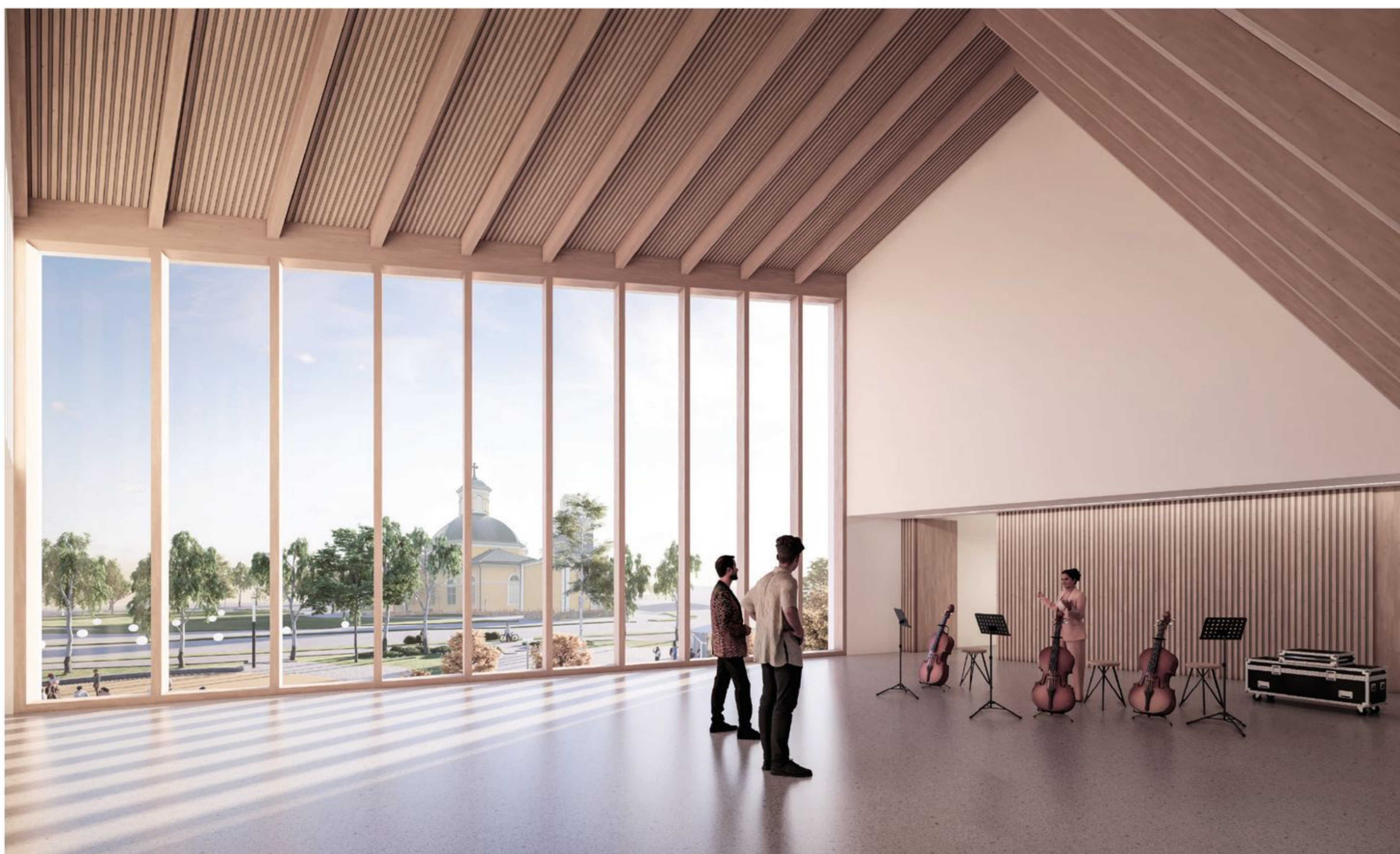
Sisänäkymä, valtuustosali (konserttilanne)