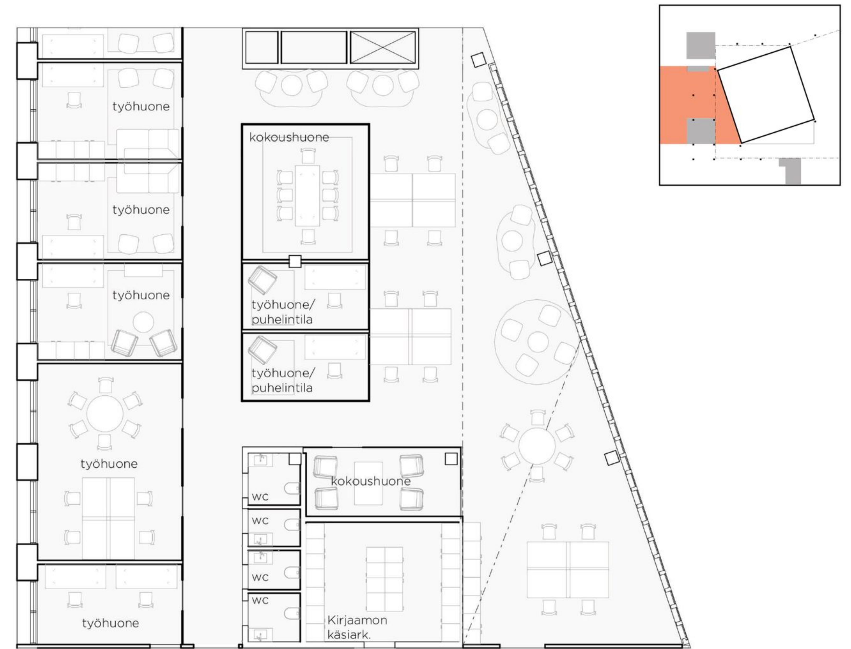
Pohjapiirustusotte, 2.krs osasto 1:150