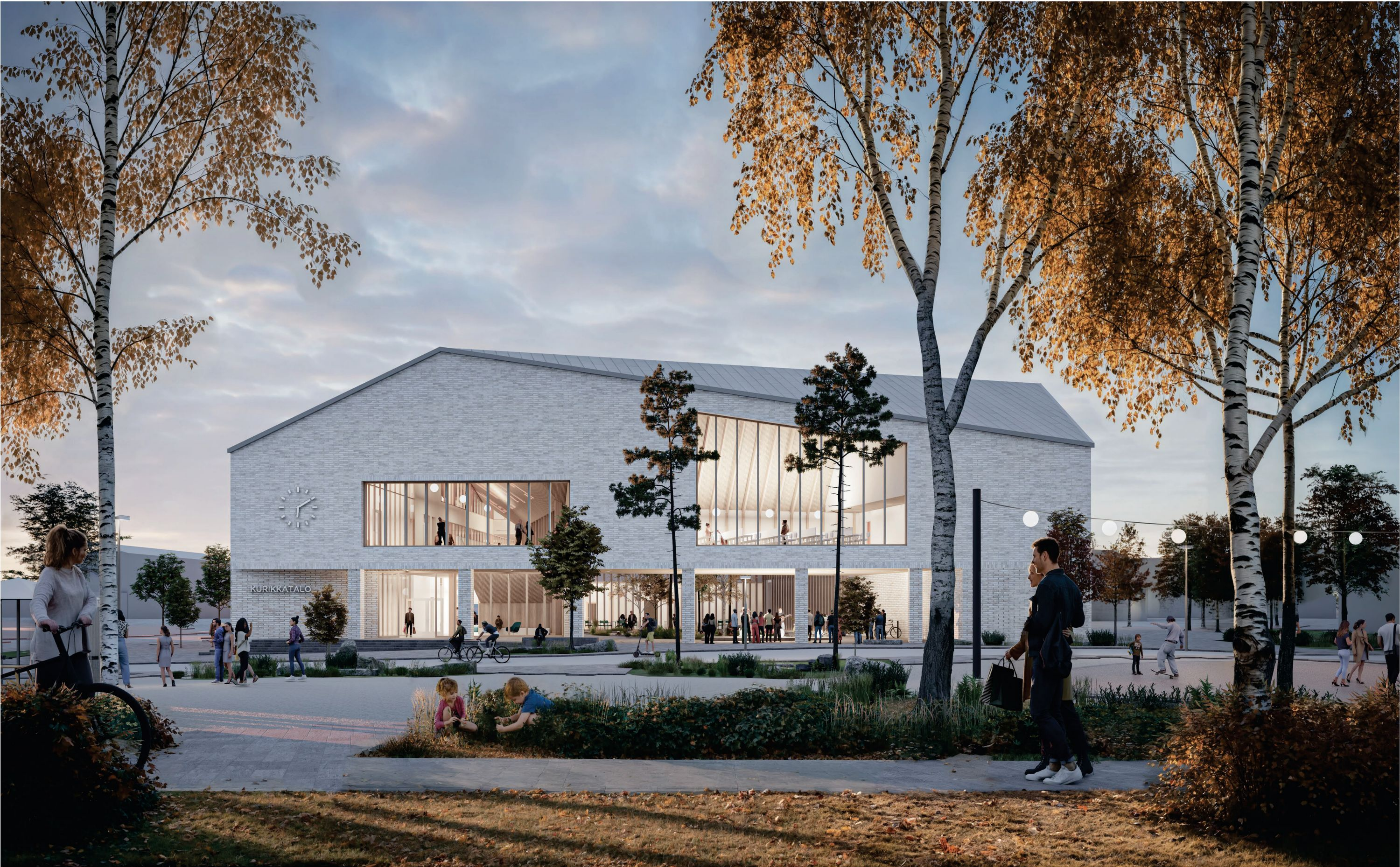
Havainnekuva torilta (Julkisivu)