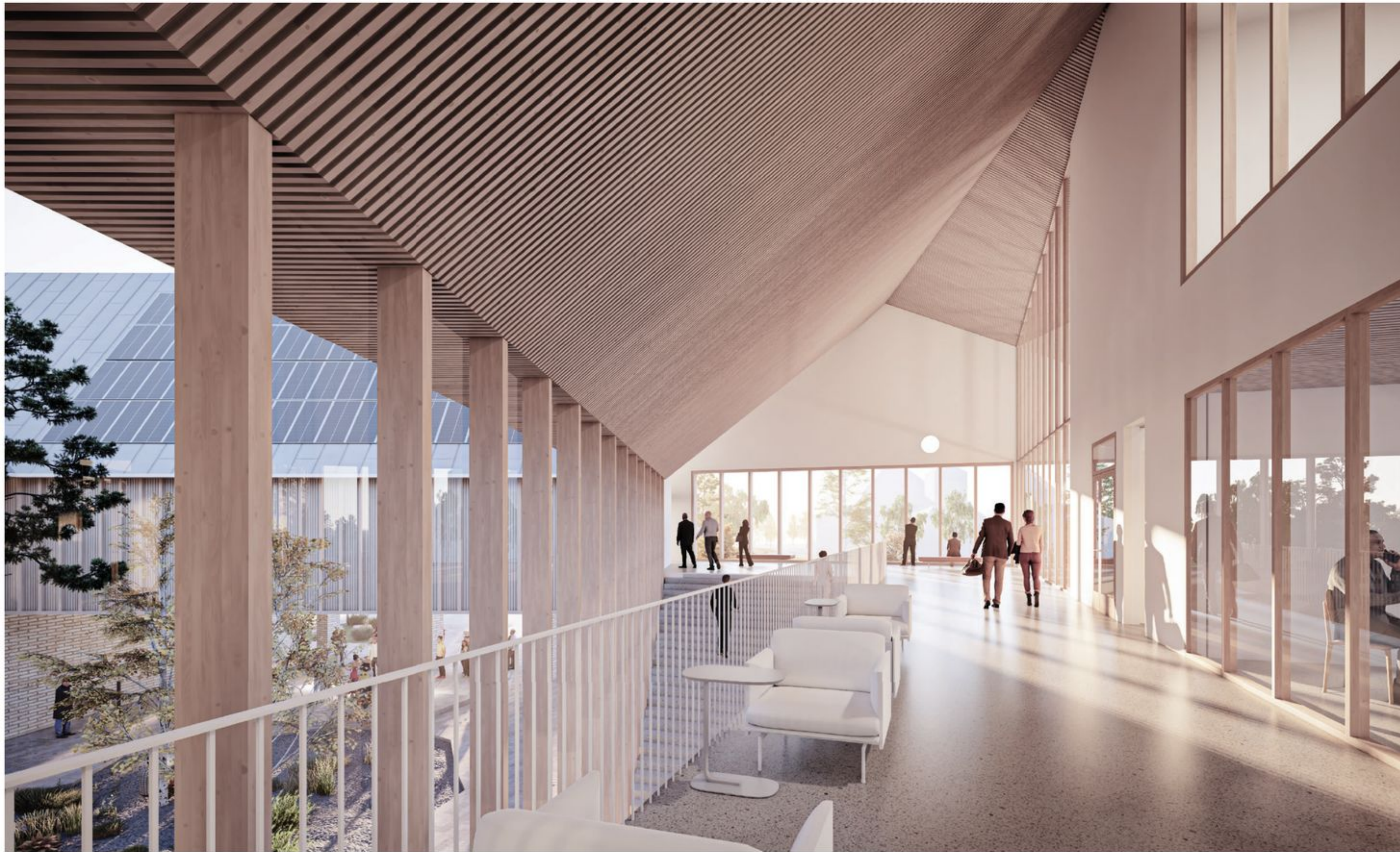
Sisänäkymä, 2.krs aula