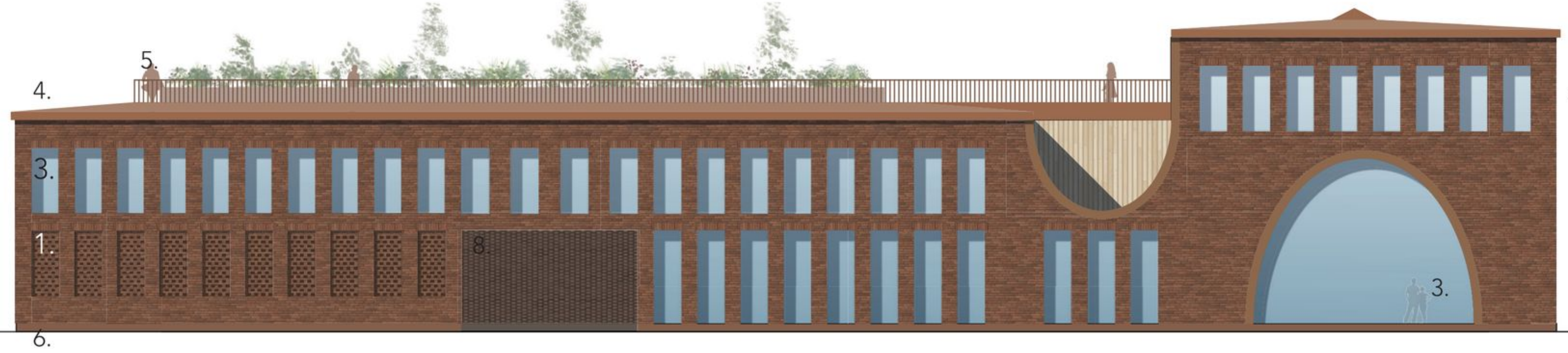
Julkisivu länteen 1:250