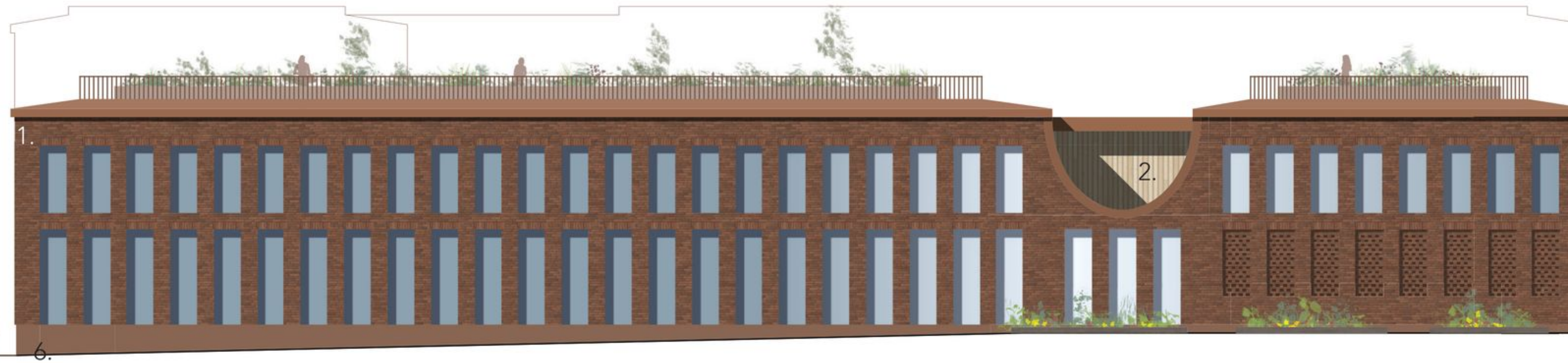
Julkisivu pohjoiseen 1:250