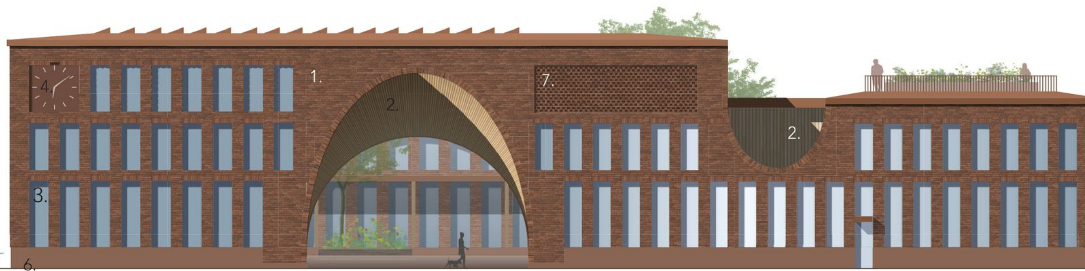
Julkisivu itään 1:250