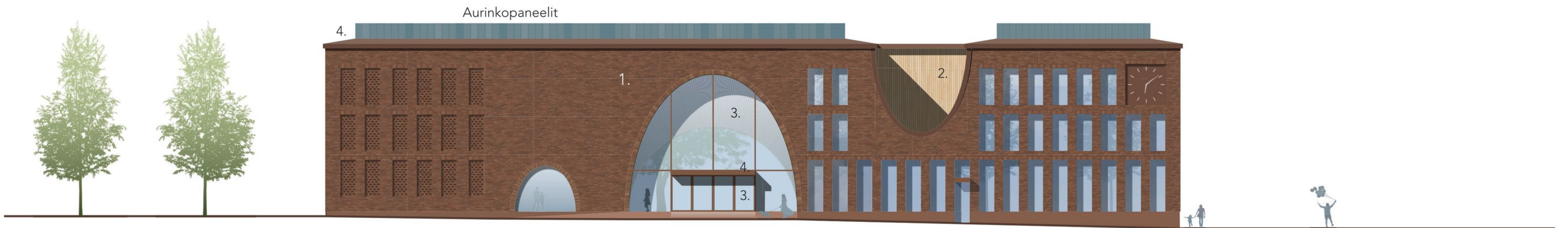
Julkisivu etelään 1:250