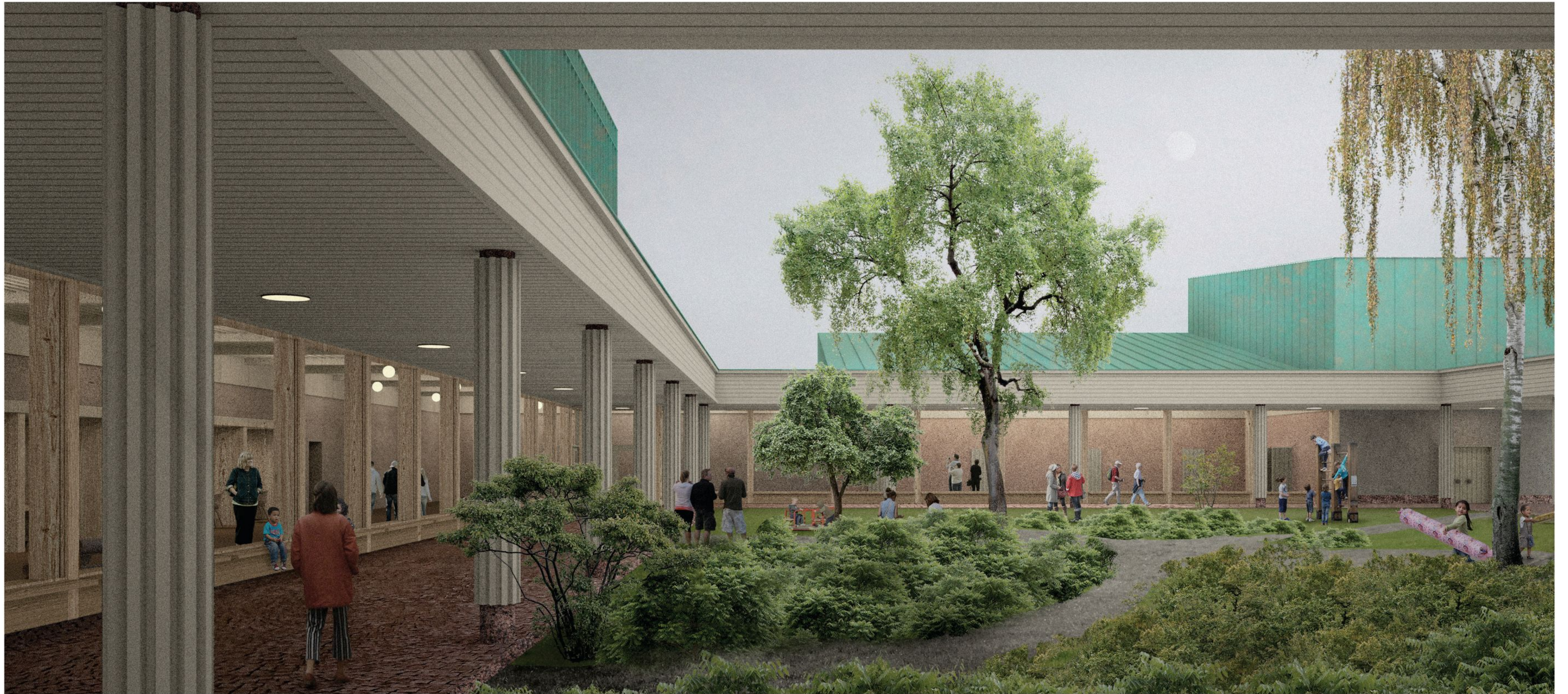
Toiminnot kerääntyvät jaetun arkadipihan äärelle.