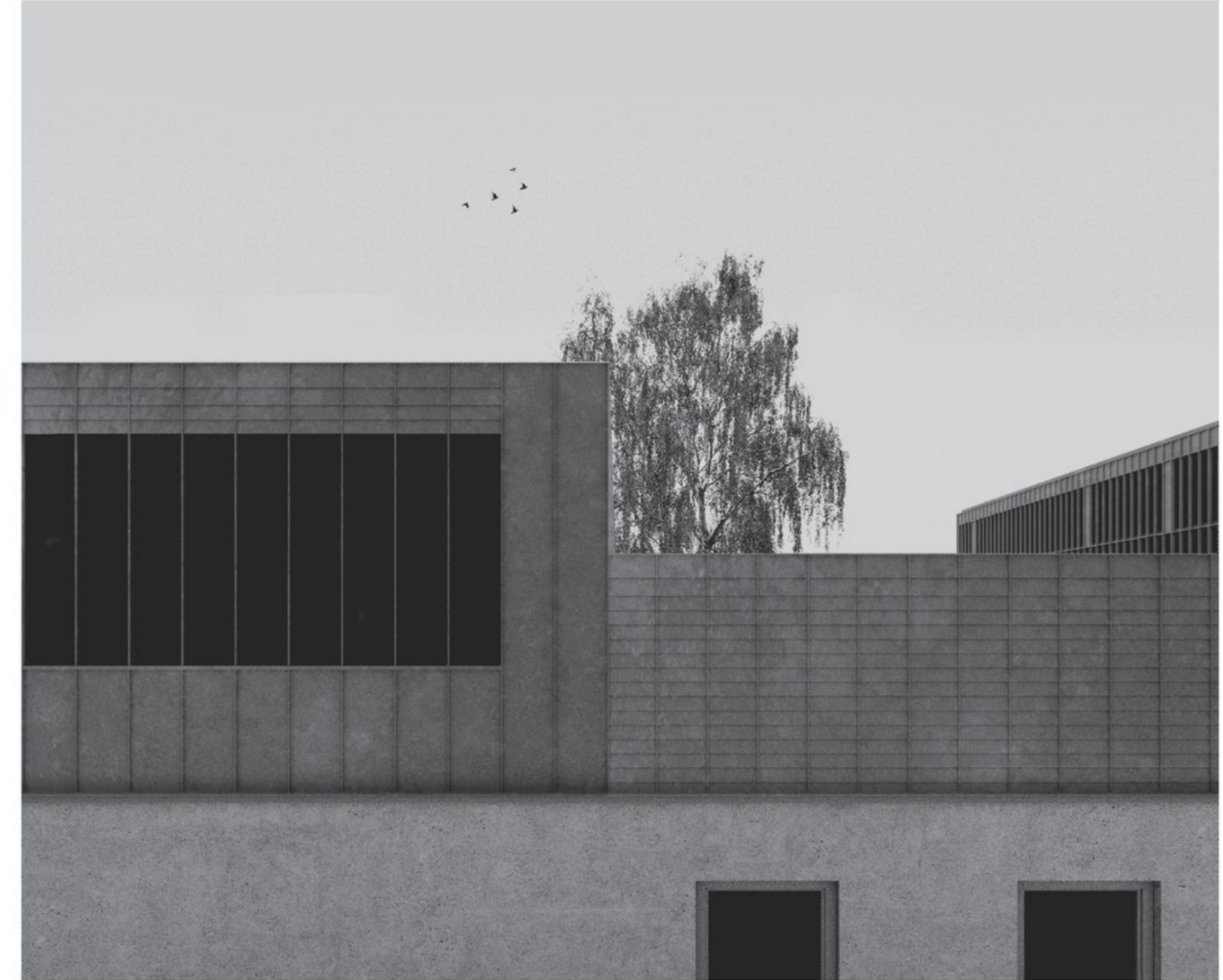
Valtuustosalin ikkuna osoittaa pohjoiseen ja tuo pehmeää valoa saliin hiekkapuhallettujen lasitusten läpi.

Kurikkatalo ei ole kaupunkitilassa vain toteava rakennelma. Kokonaisuus koostuu osista, jotka limittyvät yhteen vailla pakkopaitaa, luoden yhtenäisen ja määrätietoisin — mutta luonteeltaan myös monipuolisen ja rikkaan — tilakappaleiden ja toimintojen sommitelman.