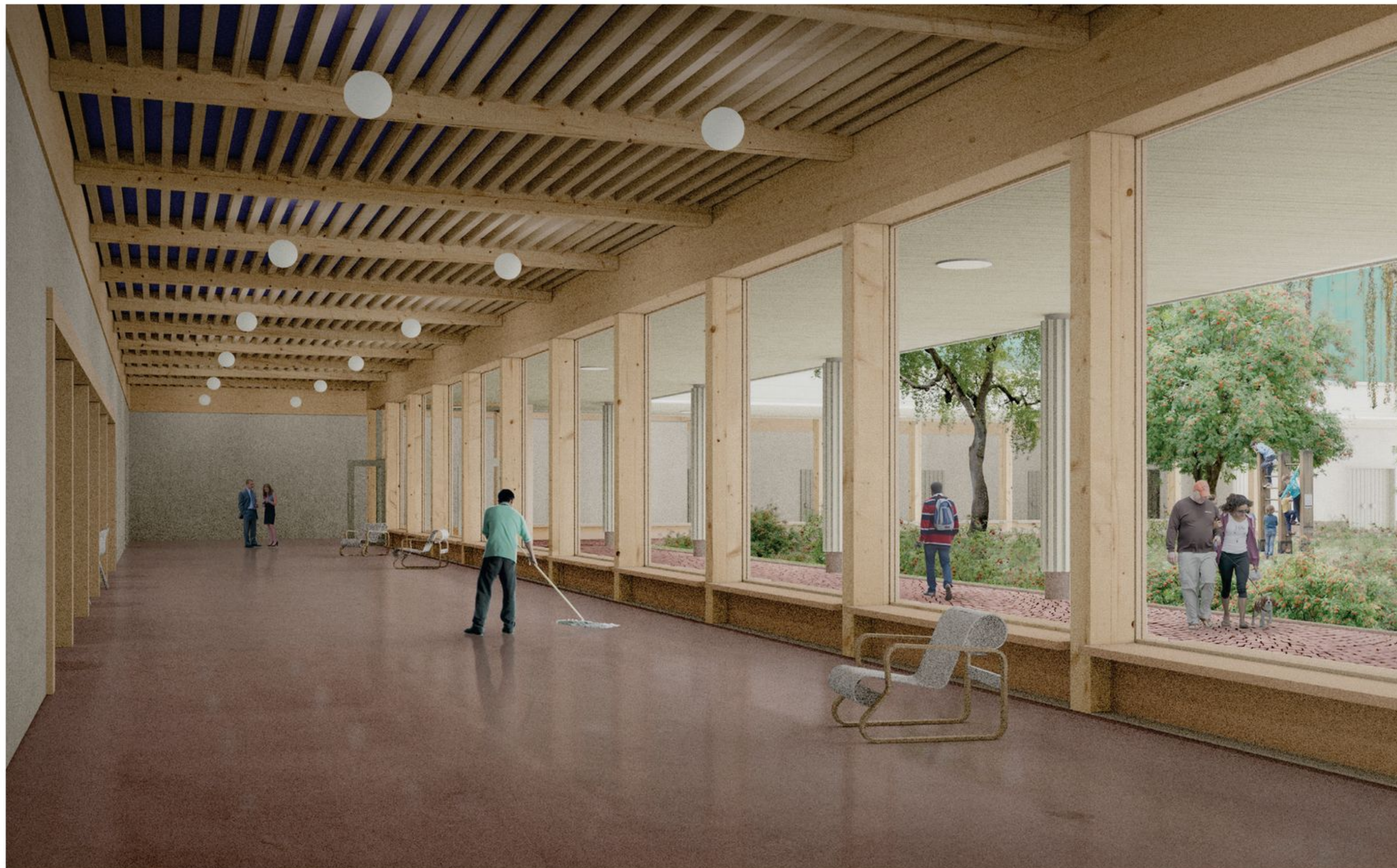
Aulatioissa vallitsee kodikas ja intiimi tunnelma.