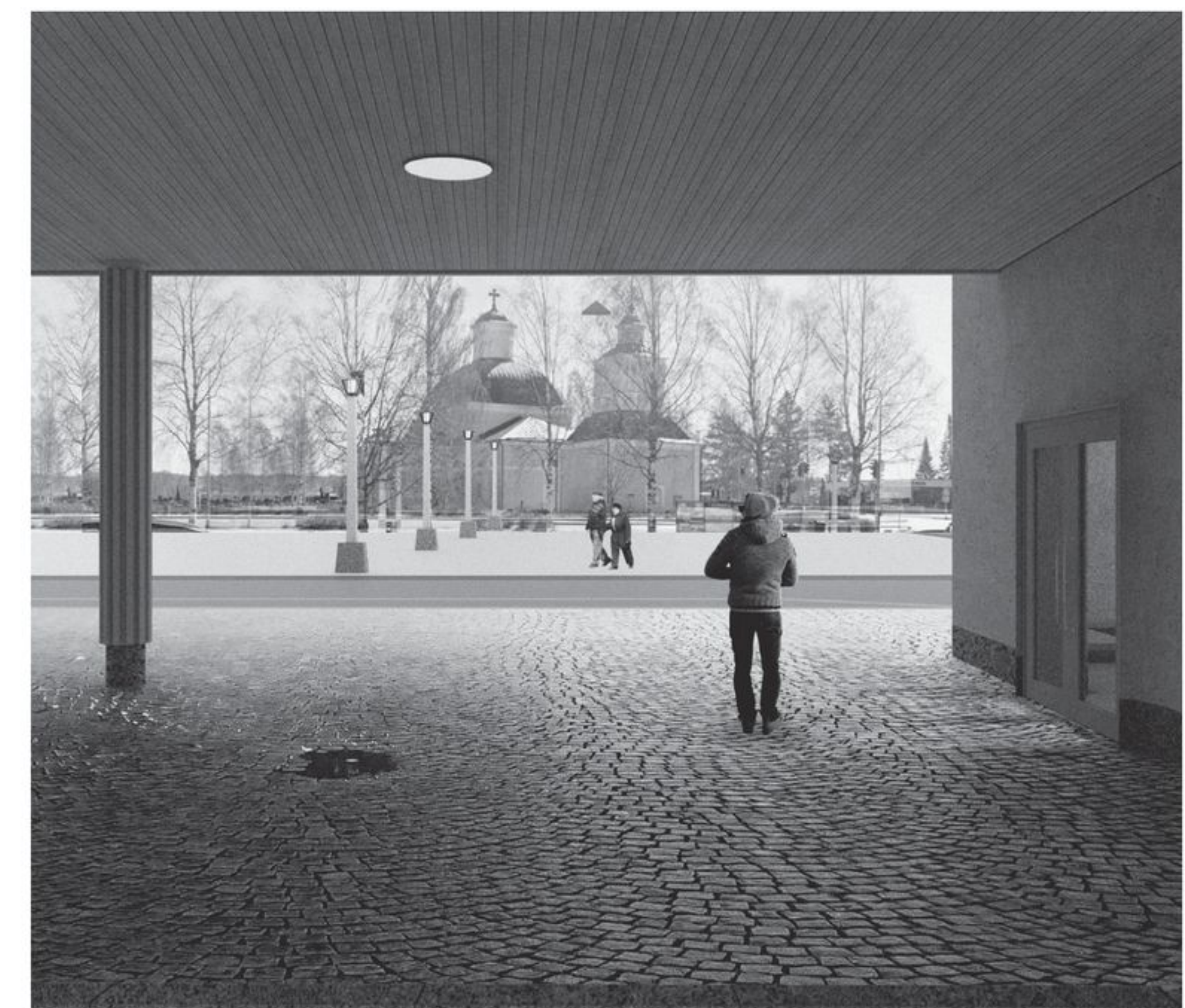
Pihan rajapinta ympäristöönsä on huokoinen ja suojaava.