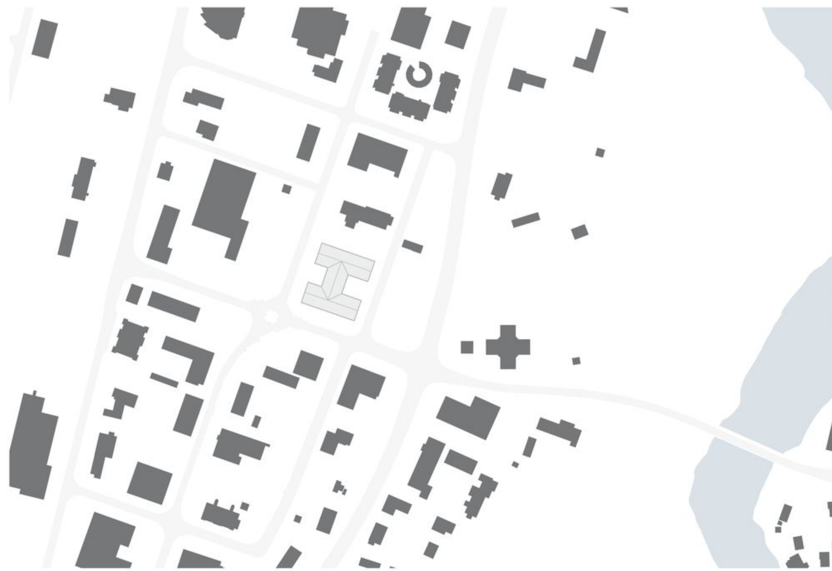
Rakennuksen liittyminen ympäristöön 1:5000