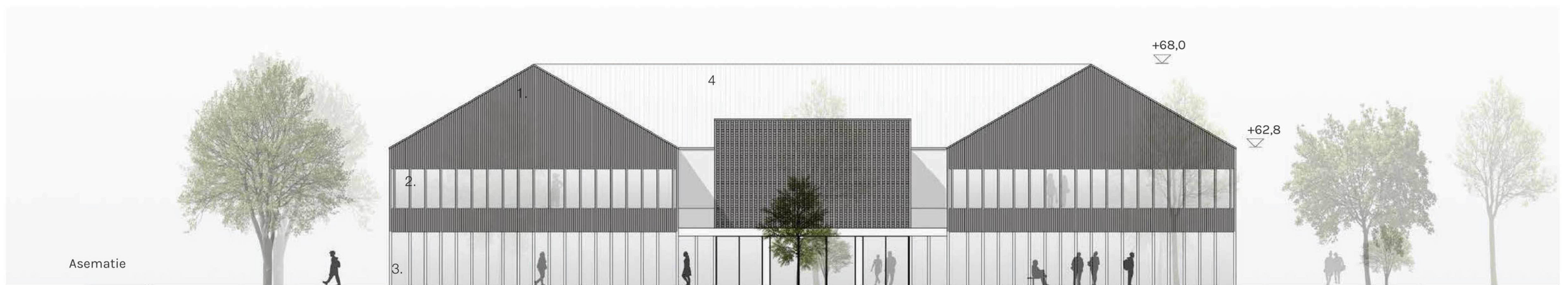
JULKISIVU ITÄÄN 1:250