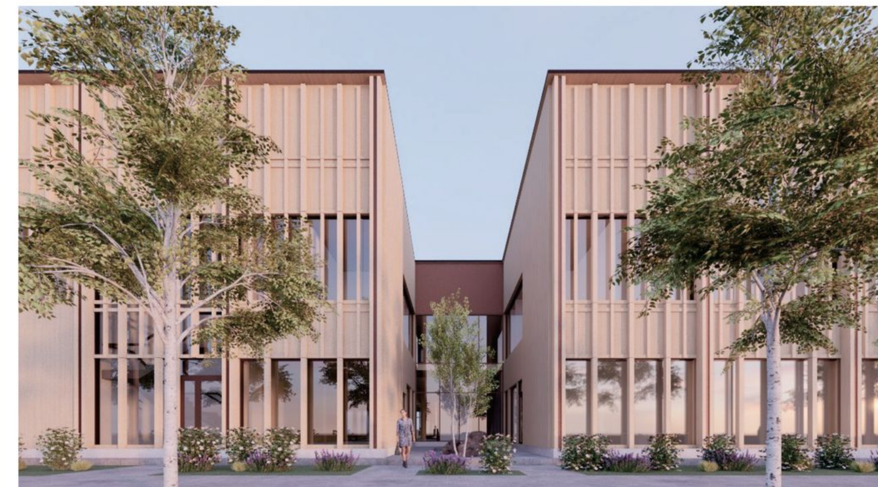
Näkymä Keskuspuistikon puolelta