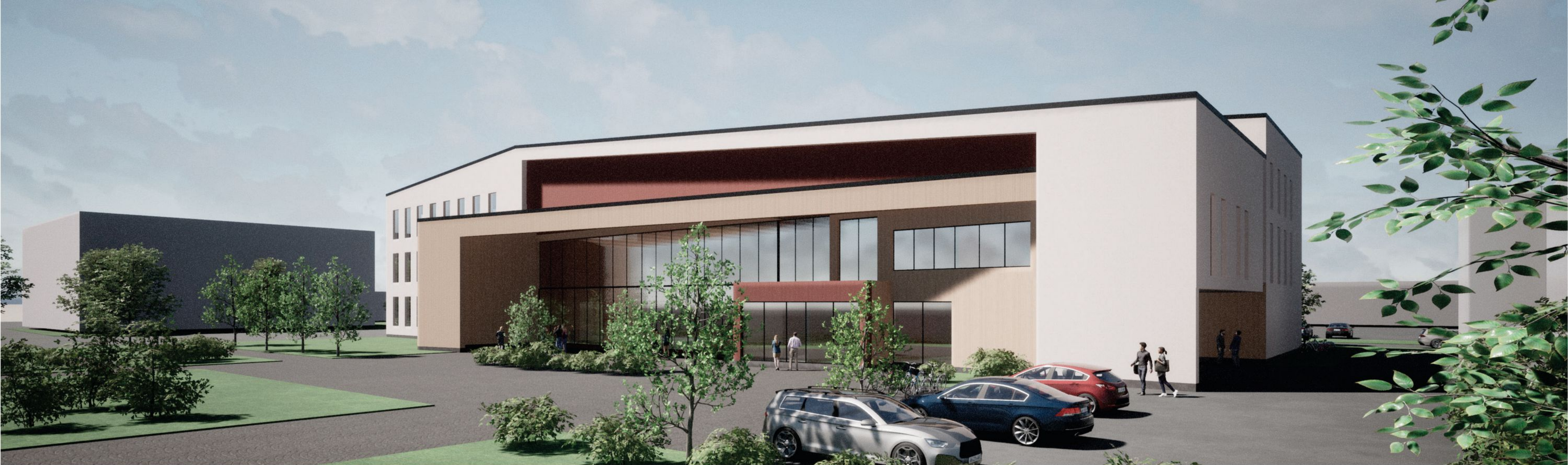
Näkymä torin suunnasta