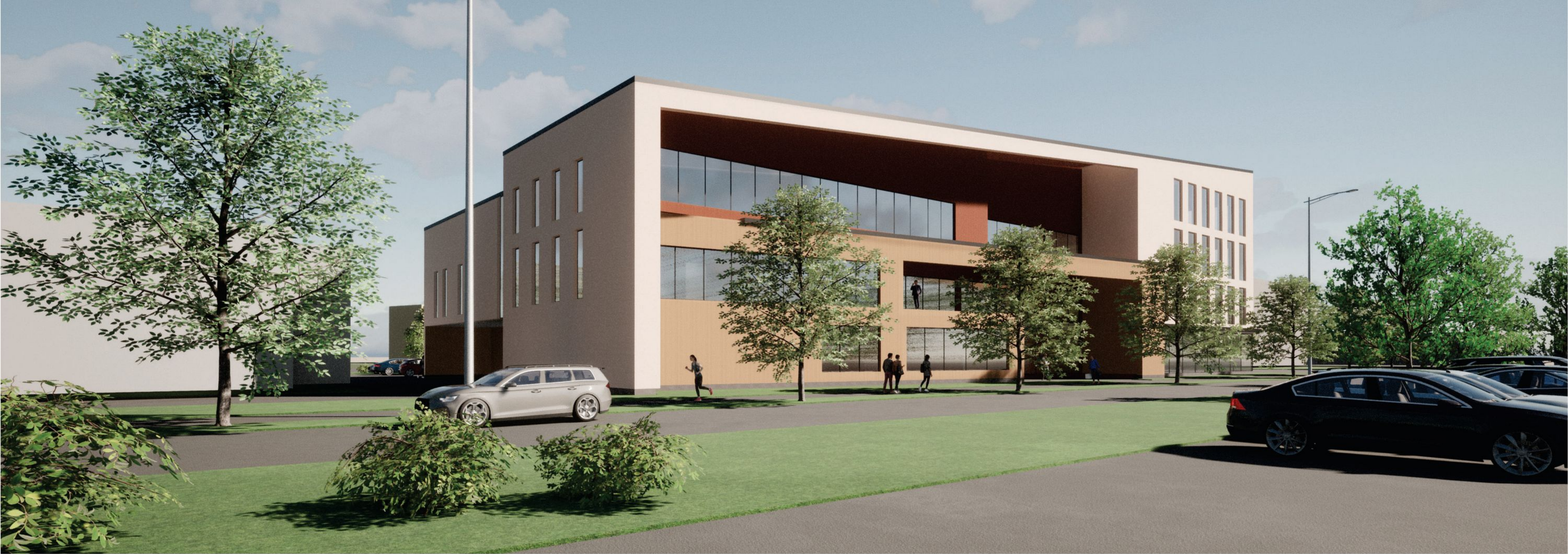
Näkymä kaupan parkkipaikalta