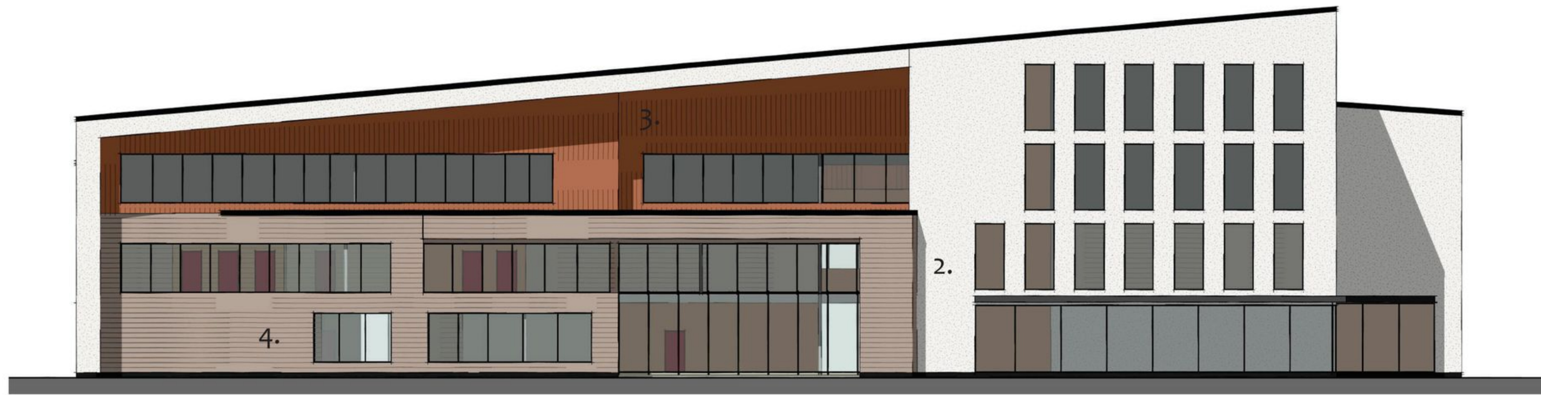
julkisivu länteen 1:300