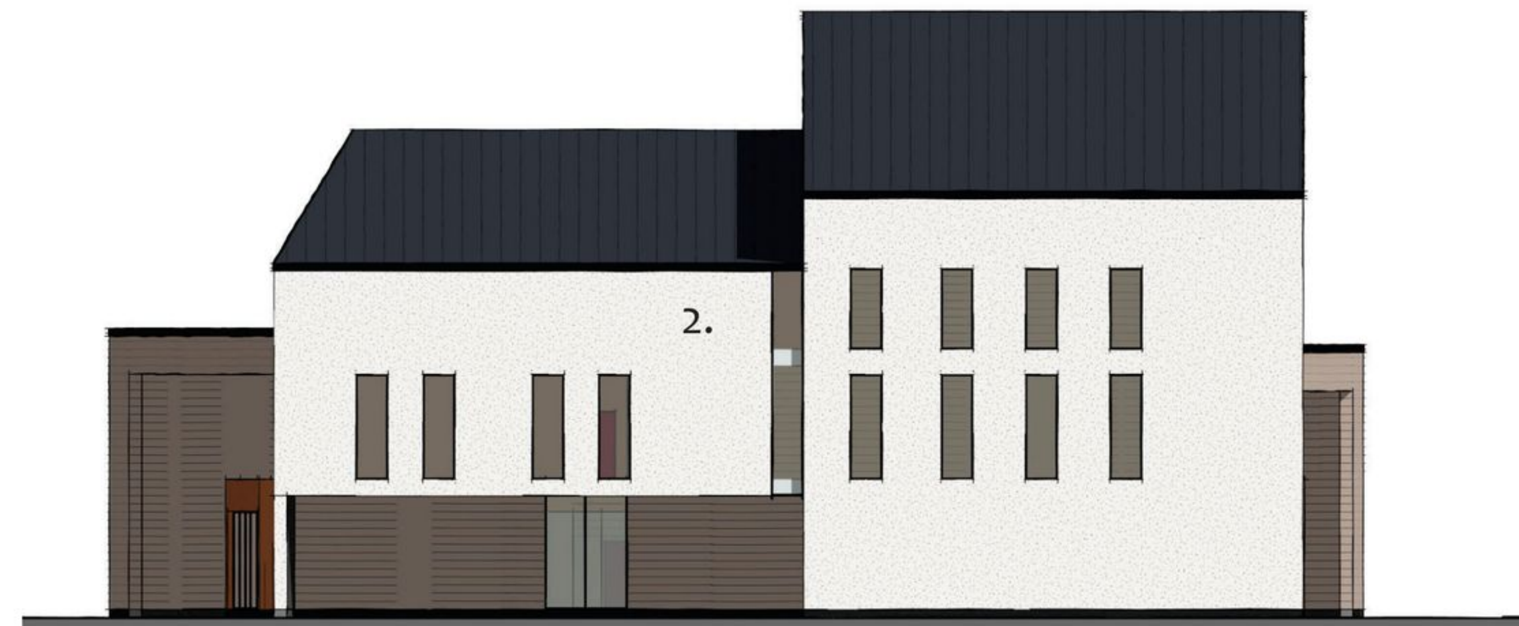
julkisivu pohjoiseen 1:300