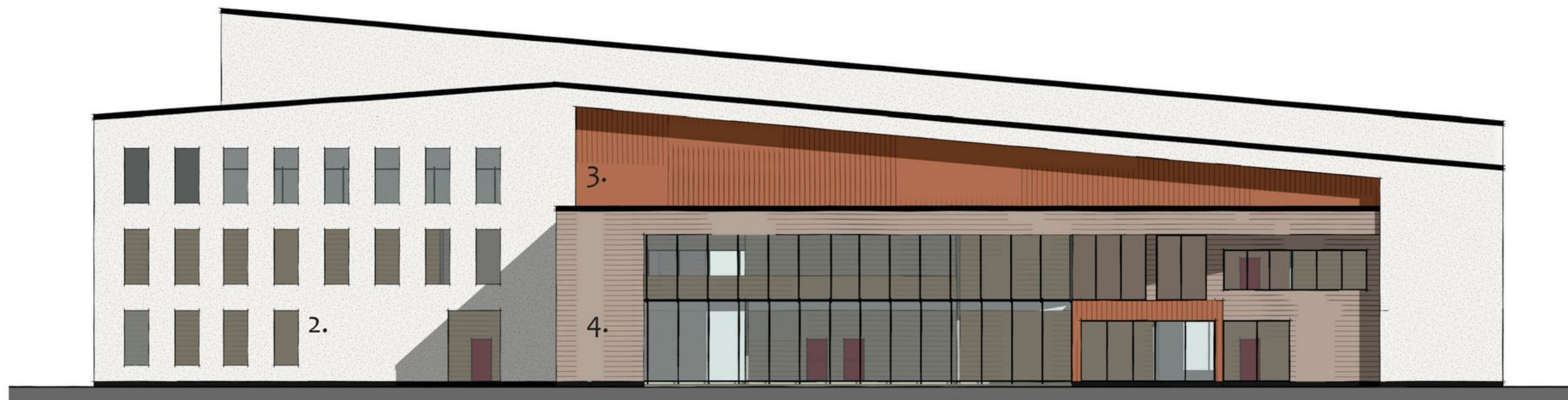
julkisivu itään 1:300