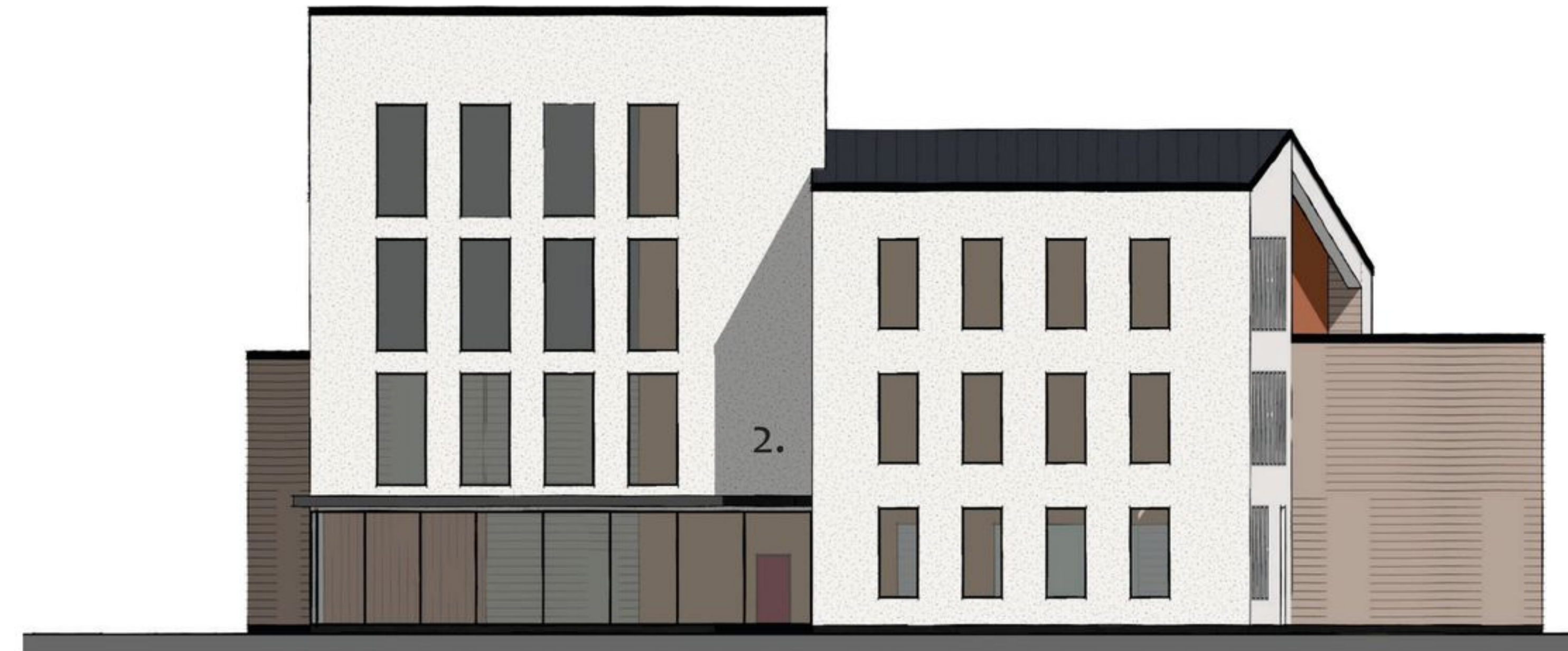
julkisivu etelään 1:300