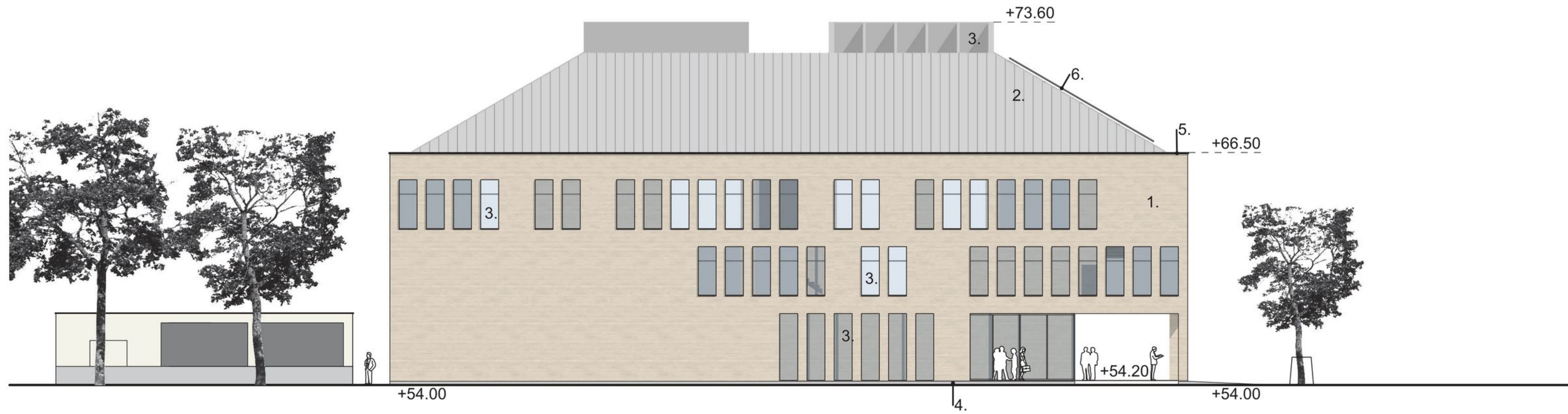
JULKISIVU LÄNTEEN 1:250