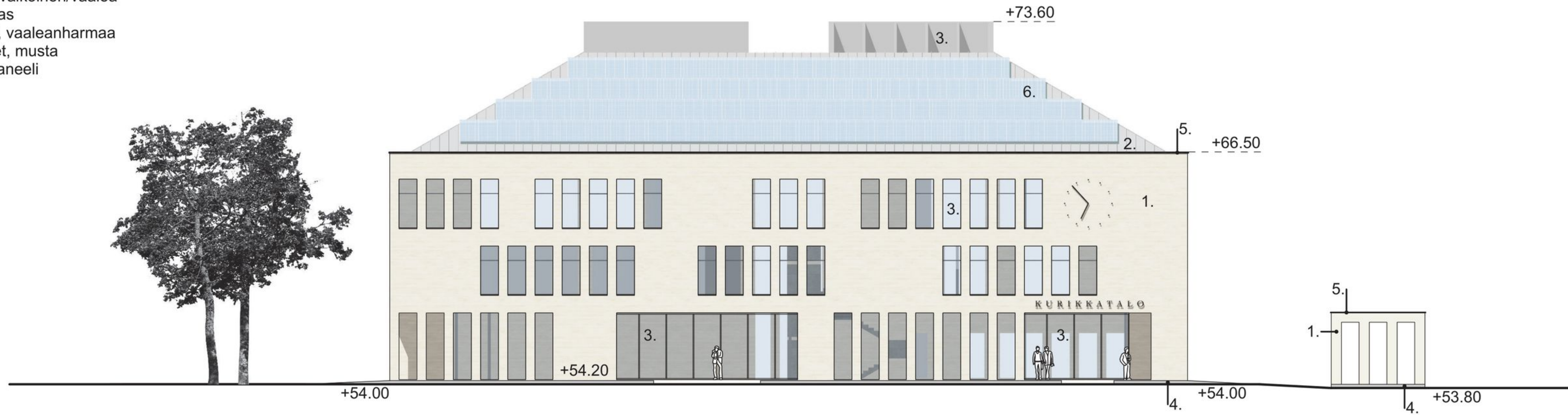
JULKISIVU ETELÄÄN 1:250