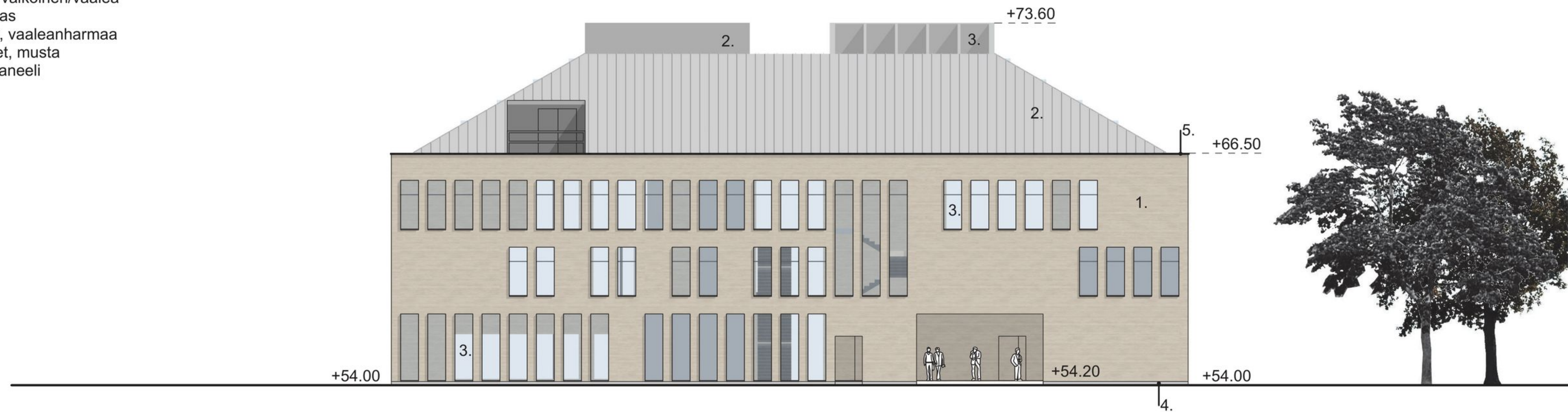
JULKISIVU POHJOISEEN 1:250