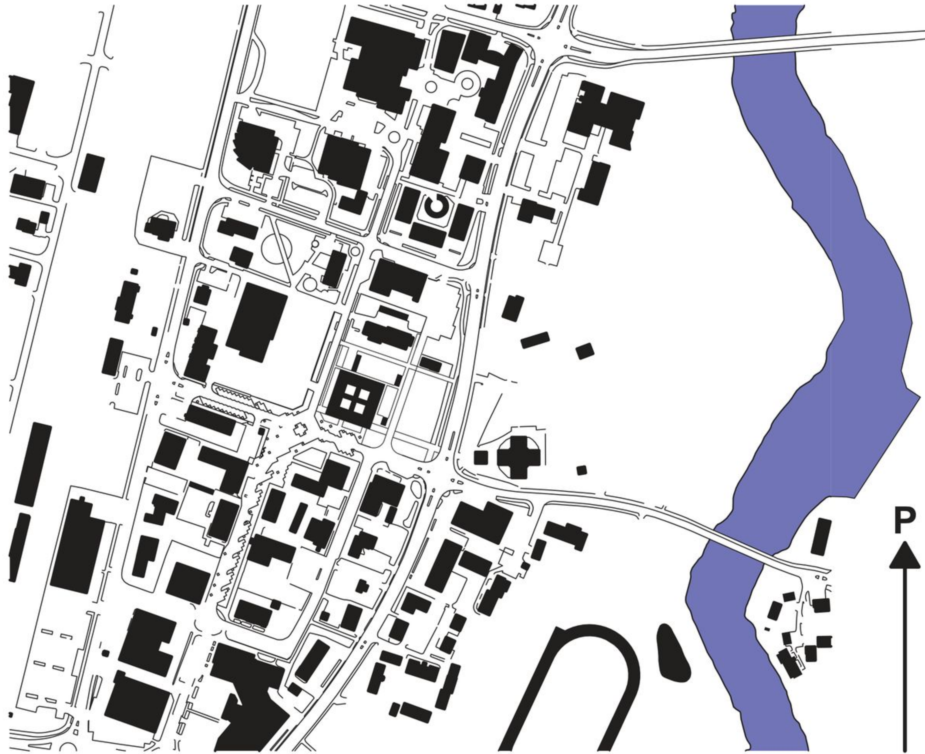
RAKENNUKSEN LIITTYMINEN YMPÄRISTÖÖN 1:5000