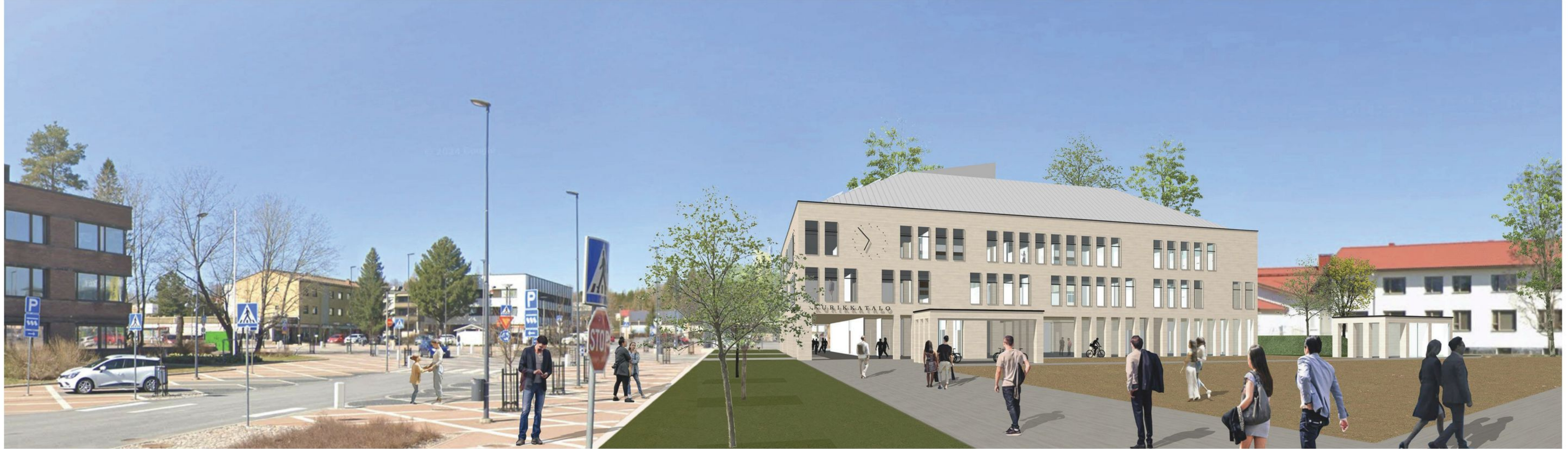
NÄKYMÄ ASEMATIEN SUUNTAISESTI LÄNTEEN