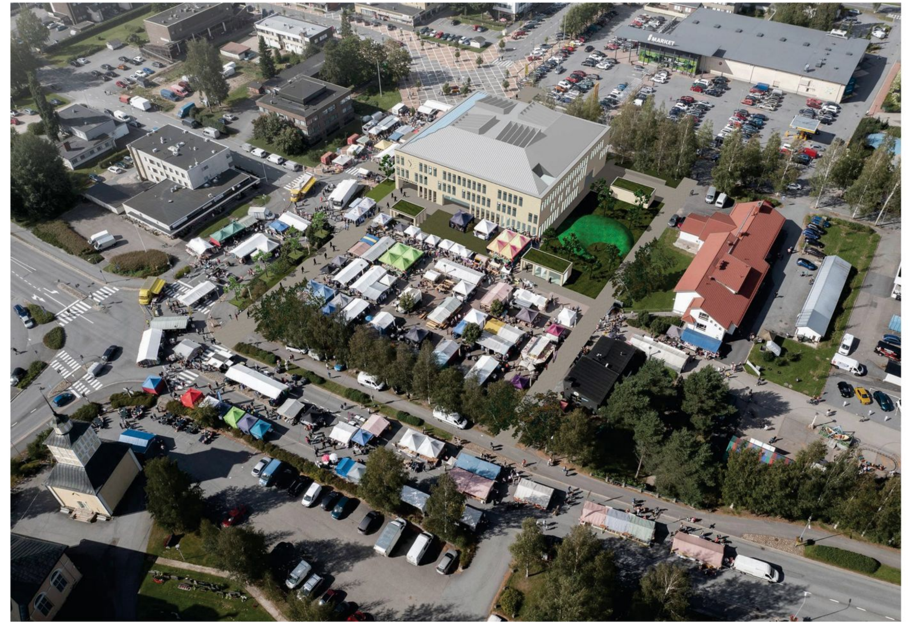
ILMAKUVA MARKKINOIDEN AIKAAN