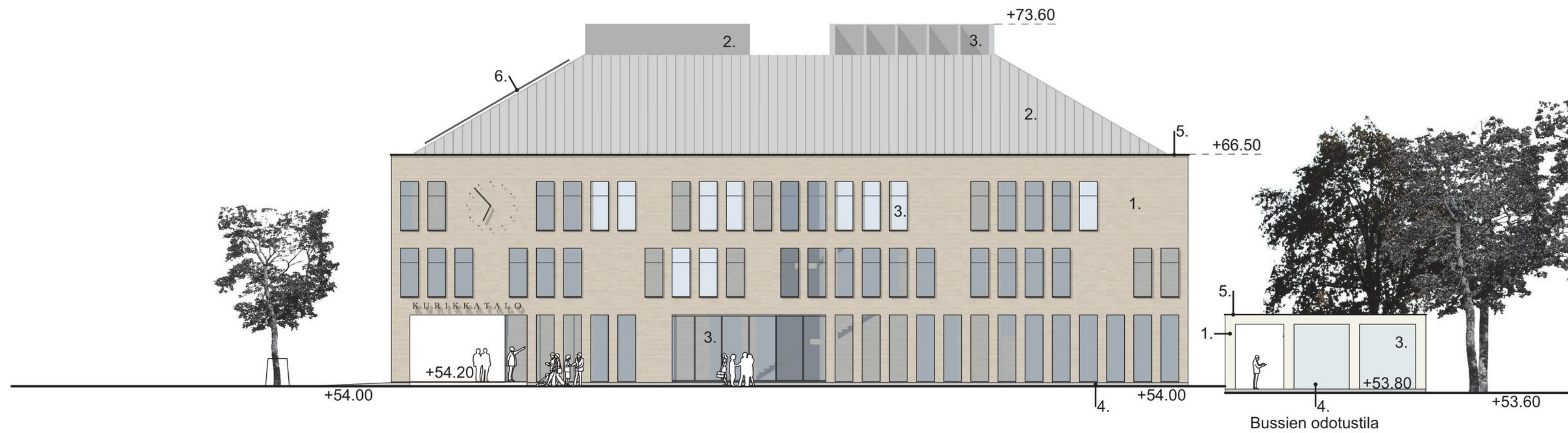
JULKISIVU ITÄÄN 1:250