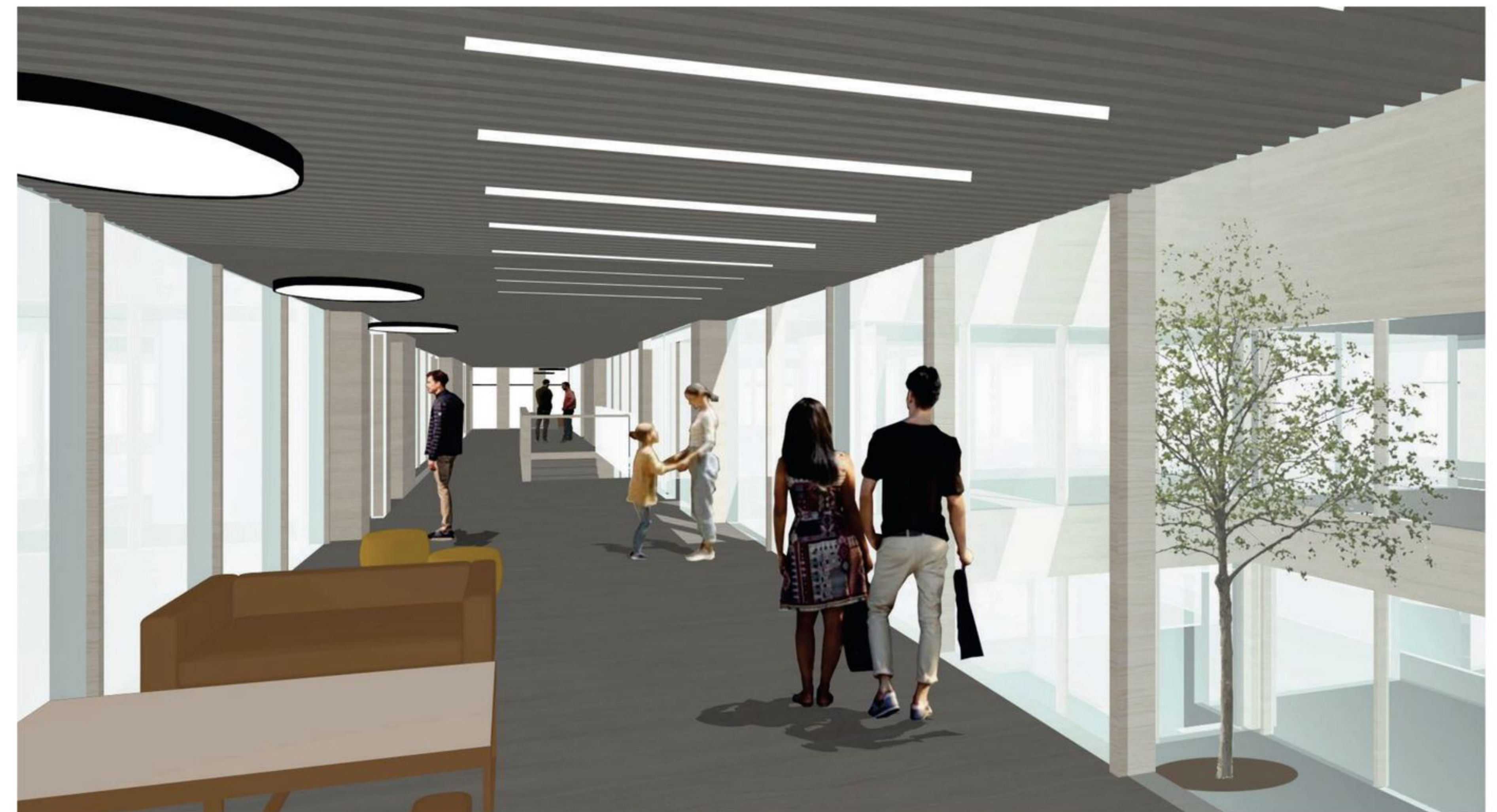
NÄKYMÄ PERUSKERROKSEN KOKOAVASTA YHTEISTILASTA