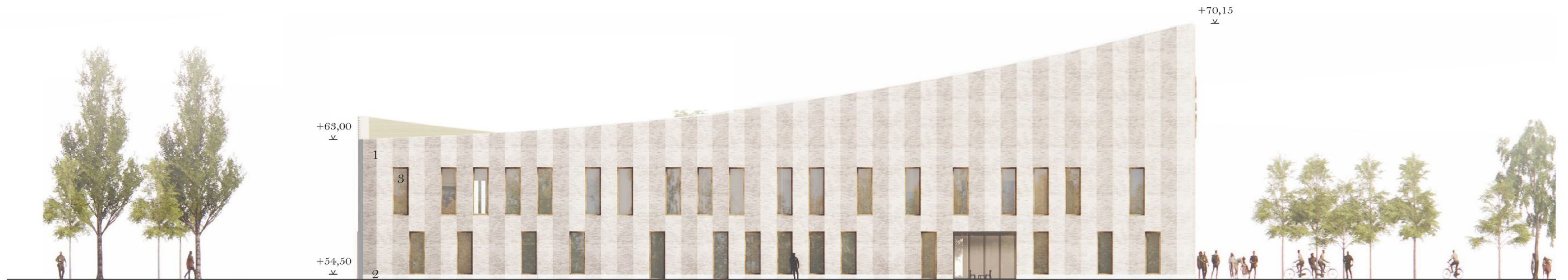
Julkisivu länteen 1:250