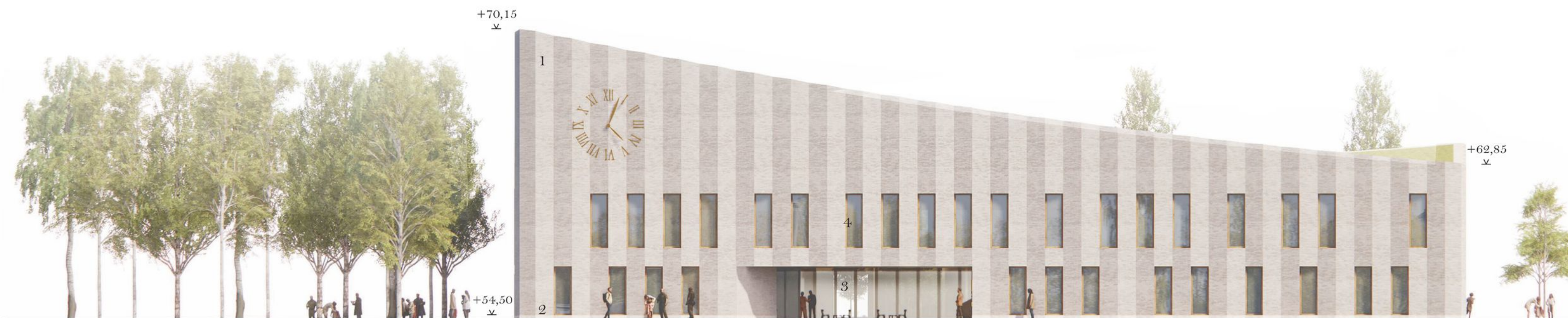
Julkisivu etelään 1:250