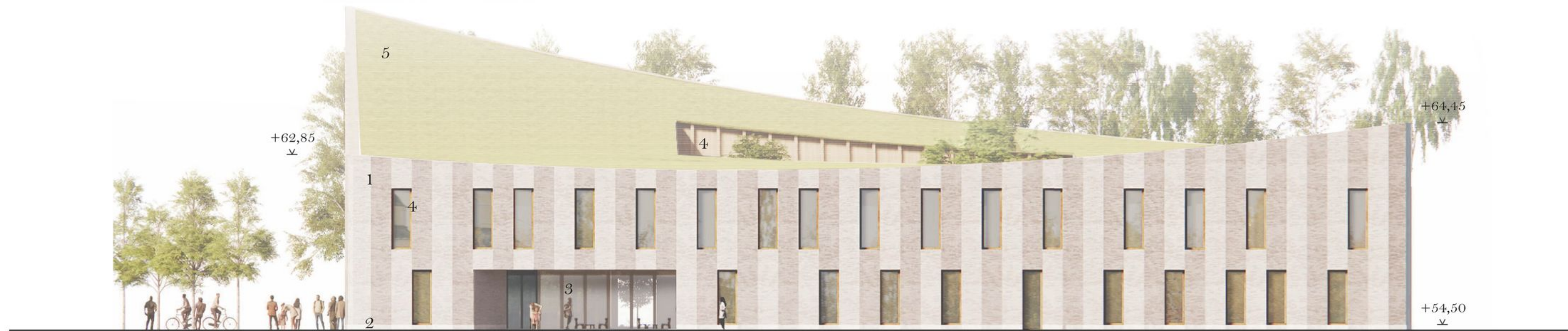
Julkisivu itään 1:250