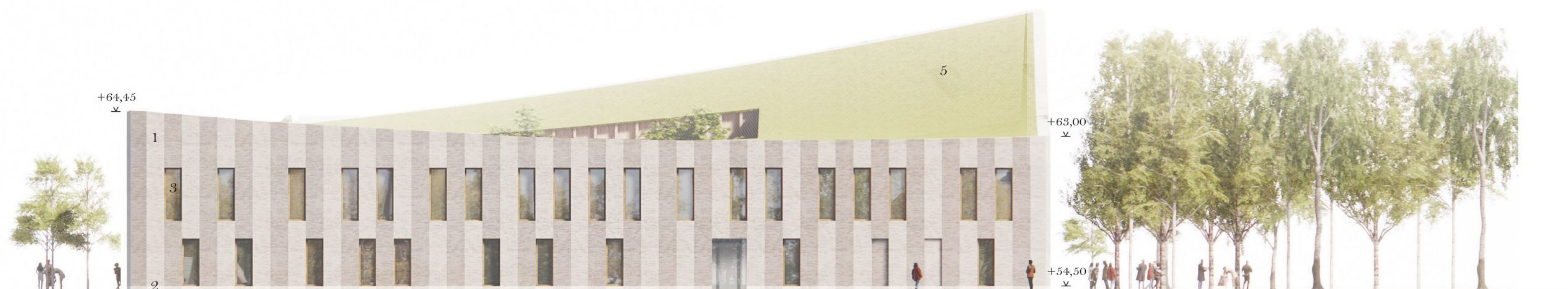
Julkisivu pohjoiseen 1:250