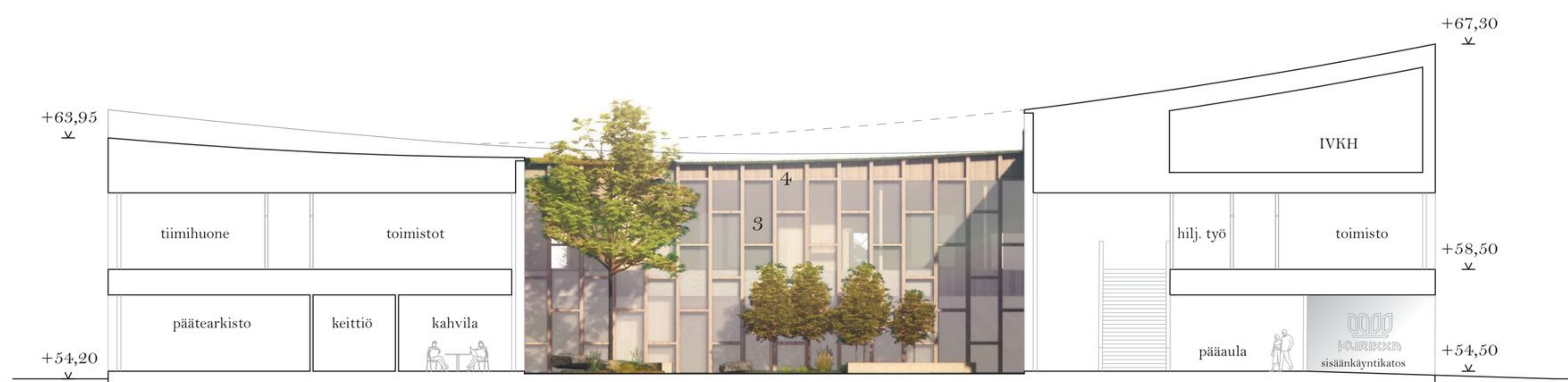
Leikkaus A-A 1:250

Kurikkatalon arkkitehtuuri syntyy selkeistä aineksista: helposti lähestyttävän kokoisesta inhimillisestä massasta jossa kattomuoto nousee ja laskee ilmeikkään pehmeästi sekä kolmiulotteisesta, kestävyystä ja ajattomuutta henkivästä tiiliverhouksesta sekä rakennuksen puiseen sydämeen - sisäpihalle - kutsuvista sisäänkäynneistä. Rakennus on vain 2-kerroksinen, joka mahdollistaa toimintojen sijoittamisen lähelle julkisen elämän tärkeintä tilaa eli katua ja toria. Ratkaisu edistää tasa-arvoa, kuntalaisten yhteisöllisyyttä ja osallisuutta sekä helpottaa palveluiden saavutettavuutta.