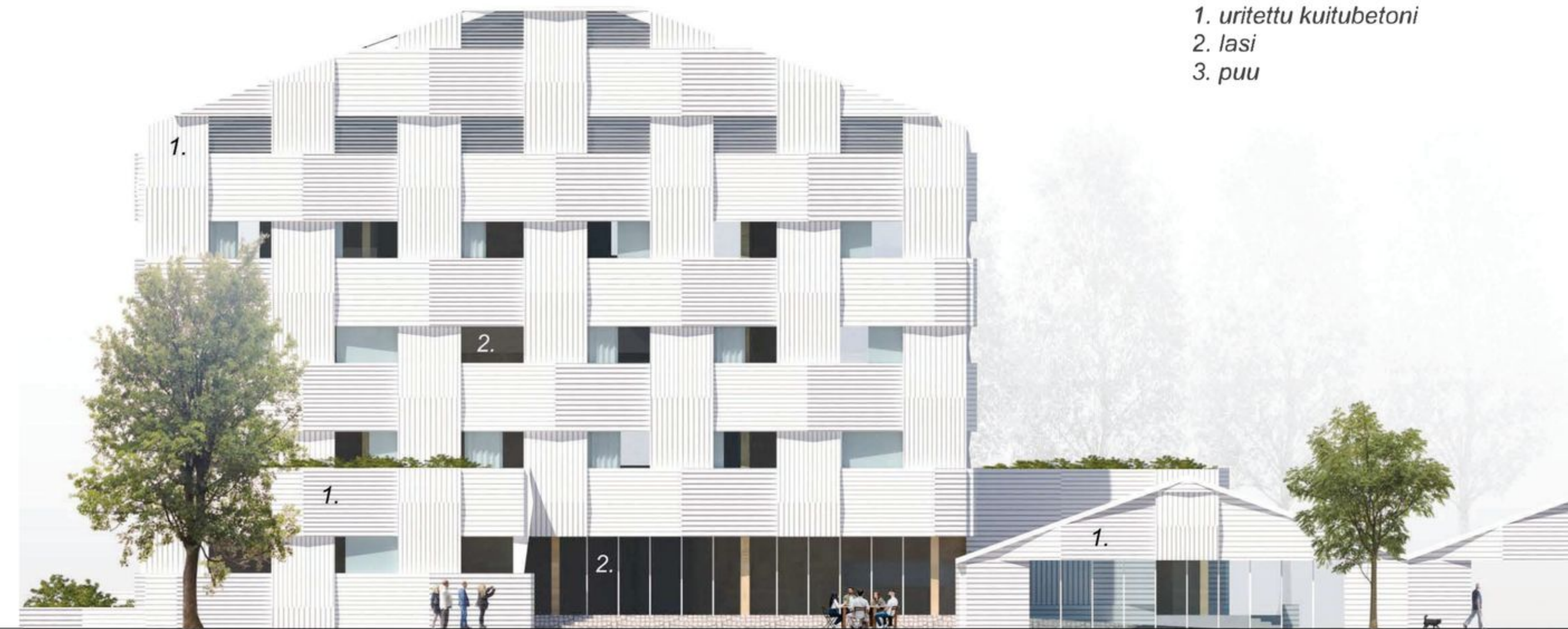
JULKISIVU ITÄÄN 1:300