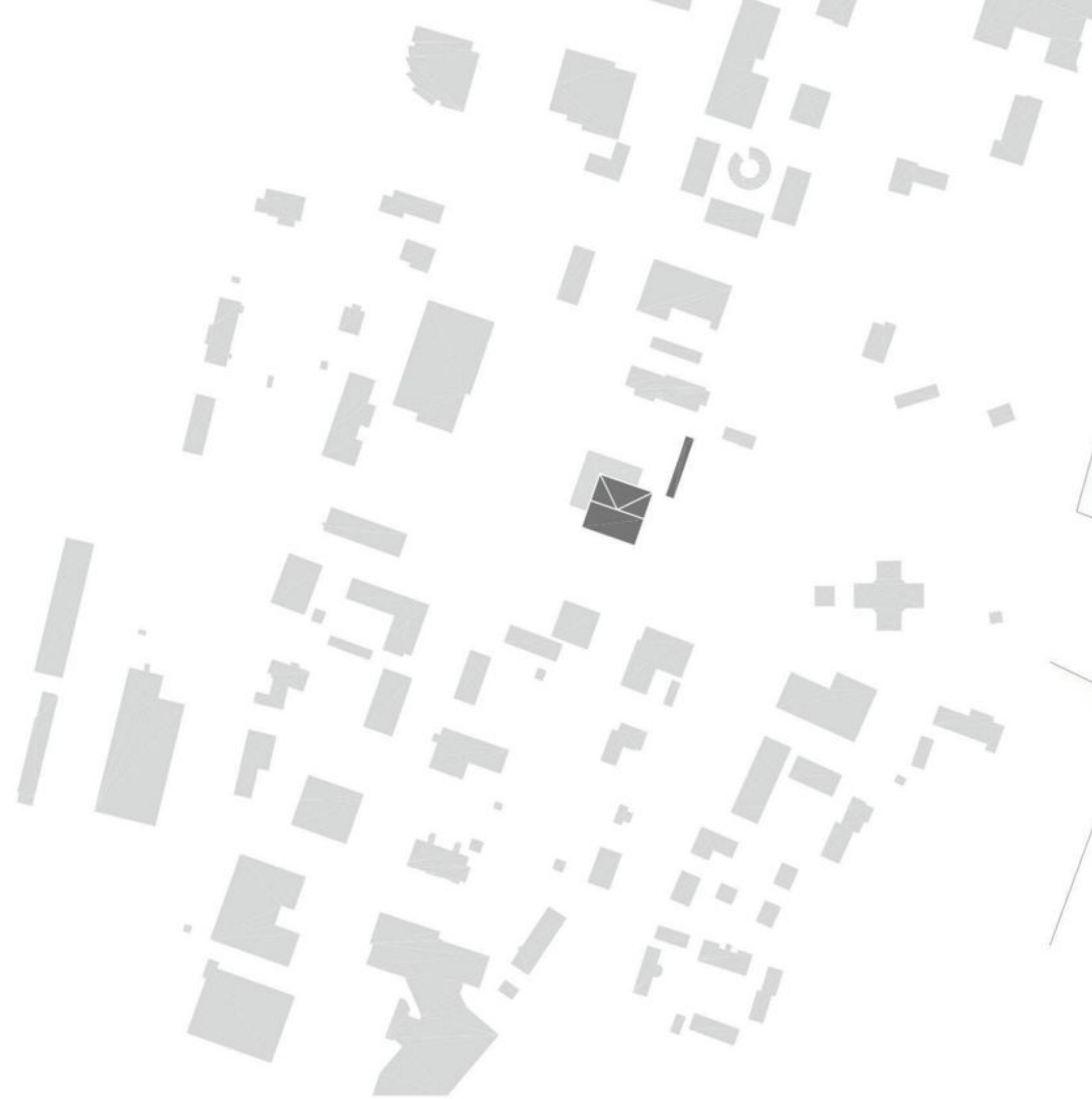
LIITTYMINEN YMPÄRISTÖÖN 1:5000